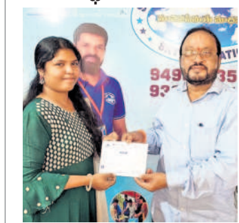
బస్సెల్లోని స్వచ్ఛం సంస్కృతి కార్యక్రమంలో ముఖ్య అతిథి

బస్సెల్లోని స్వచ్ఛం సంస్కృతి కార్యక్రమంలో ముఖ్య అతిథి బస్సెల్లోని స్వచ్ఛం సంస్కృతి కార్యక్రమంలో ముఖ్య అతిథి బస్సెల్లోని స్వచ్ఛం సంస్కృతి కార్యక్రమంలో ముఖ్య అతిథి