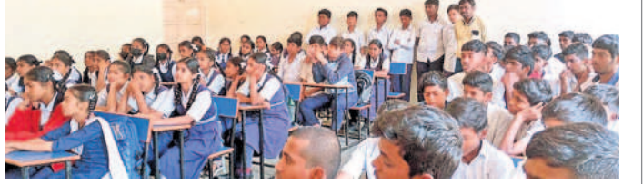
సికింద్రాబాద్, ఫిబ్రవరి 3: జాతీయ కుష్టు వ్యాధి నిర్మూలన పక్షోత్సవాల సందర్భంగా ప్రభుత్వ పాఠశాల విద్యార్థులకు అవగాహన కార్యక్రమం నిర్వహించారు.

సికింద్రాబాద్, ఫిబ్రవరి 3: జాతీయ కుష్టు వ్యాధి నిర్మూలన పక్షోత్సవాల సందర్భంగా ప్రభుత్వ పాఠశాల విద్యార్థులకు అవగాహన కార్యక్రమం నిర్వహించారు. సర్కు లెప్టోస్పైరా అవగాహన కార్యక్రమం పక్షోత్సవాలను తెలంగాణ ముఖ్యమంత్రి రేవంత్ రెడ్డి గత నెల 30న ప్రారంభించారు. ఈ నెల 13వ తేదీ వరకు నిర్వహిస్తున్నారు. శనివారం హైదరాబాద్ జిల్లా వైద్య ఆరోగ్య శాఖ (ఎంఐ), లెప్టోస్పైరా అవగాహన ప్రభావిత అధ్యక్షులతో సాఫల్యమంది కుష్టి వెర్టికల్ పరిధిలోని ప్రభుత్వ మోడల్ హైస్కూల్లో కుష్టు వ్యాధి-నిర్మూలనపై అవగాహన కార్యక్రమం