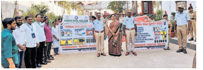
రోడ్డు భద్రతా వారోత్సవాల శిబిరాన్ని ప్రారంభించిన ప్రెసిడెంట్ డాక్టర్ సహకారం