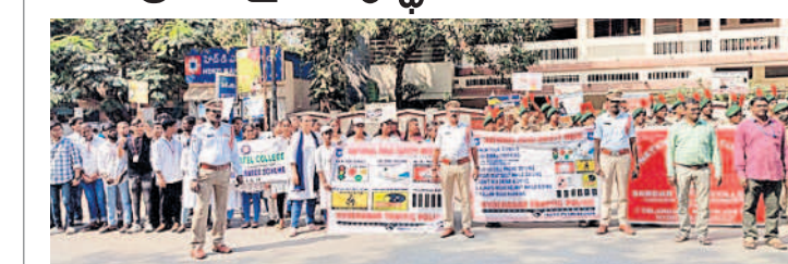
విద్యార్థులకు అవగాహన కల్పిస్తున్న విలకలగూడ ప్రాథమిక పోలీసులు

ఉస్మానియా యూనివర్సిటీ, ఫిబ్రవరి 3: జాతీయ రహదారి భద్రతా వారోత్సవాల సందర్భంగా విలకలగూడ ప్రాథమిక పోలీసులు వాసులు అధ్యక్షులతో పోలీసులు విద్యార్థులకు ట్రాఫిక్పై అవగాహన కల్పించారు. ఇంటర్మీడియట్, డిగ్రీ విద్యార్థులు, ఎన్.పీ.సీ. రిజర్వేషన్, ఎస్.పి.ఎస్. వాలంటరీ కలిసి అవగాహన కార్యక్రమం నిర్వహించి, ట్రాఫిక్