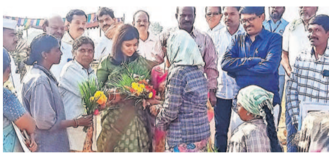
సిద్ధిపేట రూరల్: అడివేసల్ కలెక్టర్లకు పూలతో స్వాగతం పలుకుతున్న చాలీలు

చేసి పొలాలకు సాగునీరు అందించాలన్నారు. కేసీఆర్ భగీరథ ప్రయత్నం వల్లే కొండపోచమ్మ, మల్లన్నసాగర్ రిజర్వాయర్లు జలాబాంధ్రా కాలాగ్రామాలకు మారాయన్నారు. గత ప్రభుత్వ హయాంలో ఏడాదికి రెండు, మూడు పంటలు సాగు చేసే రైతులు ఆరు ప్రాంతాల్లో సాధించారని చెప్పారు. కాంగ్రెస్ అధికారంలోకి వచ్చిన తర్వాత ఈ సారి రాష్ట్రంలో 40 శాతం మంది రైతులు నాణ్య వేయలేదని పేర్కొన్నారు.