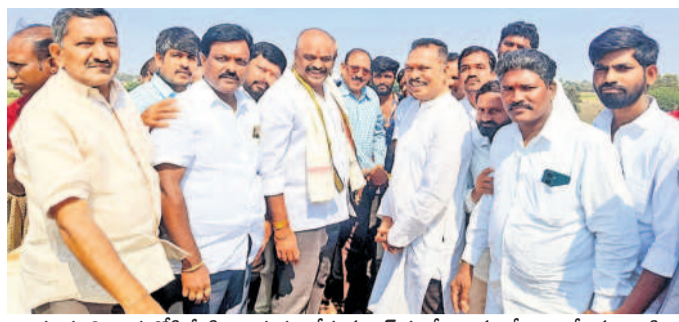
కూడవెల్లి వాగులోకి నీటిని విడుదల చేస్తున్న ఎన్ఈకే వేణు, మాజీ ఎమ్మెల్యే సర్కార్