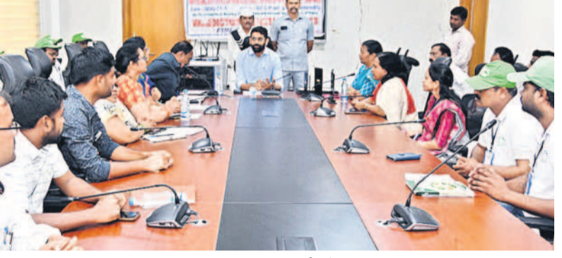
మాట్లాడుతున్న కల్తర జితే పీ పాటిల్