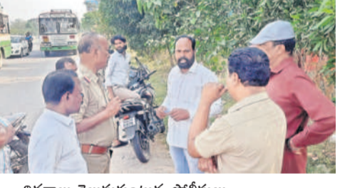
వీవరాలు తెలుసుకుంటున్న పోలీసులు