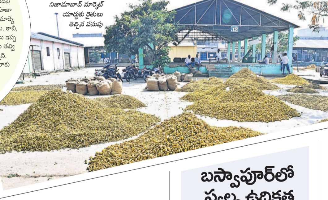
నిజామాబాద్ మార్కెట్ యార్జకు రైతులు తెచ్చిన పనుపు