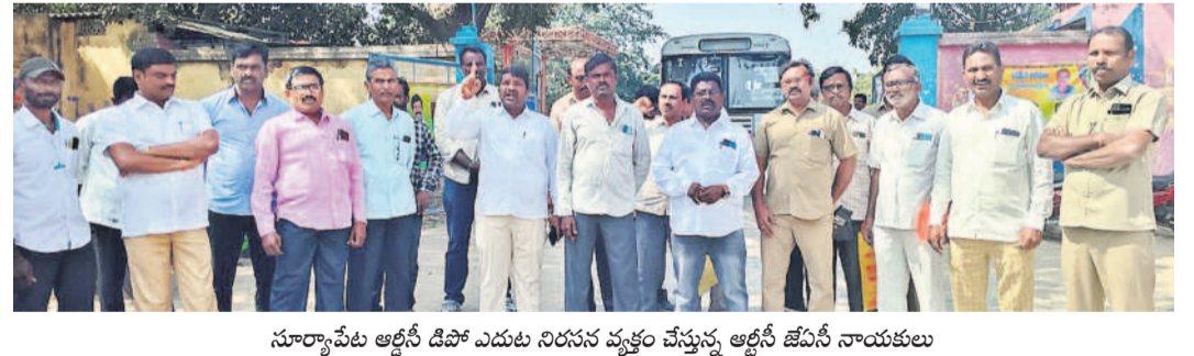
సూర్యాపేట ఆర్టీసీ డిపో ఎదుట నిరసన వ్యక్తం చేస్తున్న ఆర్టీసీ జేపీసీ నాయకులు