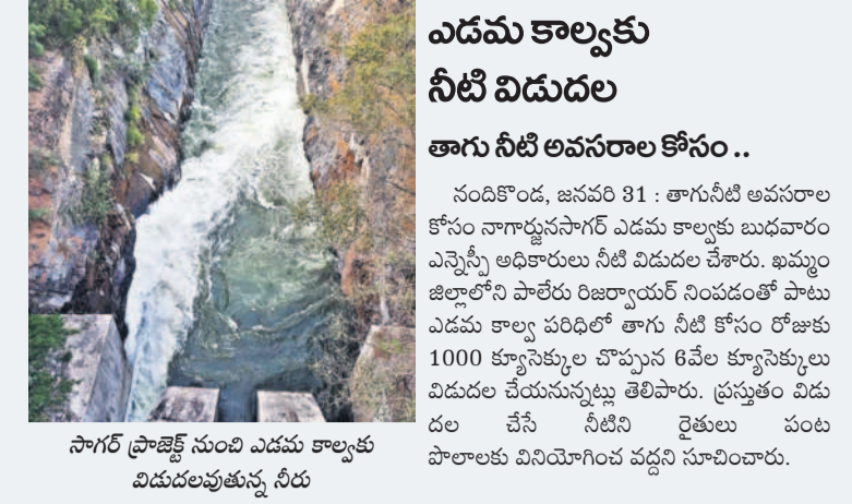
సాగర్ ప్రాజెక్ట్ నుంచి ఎడమ కాల్వకు విడుదలవుతున్న నీరు

ఎడమ కాల్వకు నీటి విడుదల తాగు నీటి అవసరాల కోసం.. నందికొండ, జనవరి 31 : తాగునీటి అవసరాల కోసం నాగార్జునసాగర్ ఎడమ కాల్వకు బుధవారం ఎన్సీసీ అధికారులు నీటి విడుదల చేశారు. ఖమ్మం జిల్లాలోని పాలేరు రిజర్వాయర్ నిండడంతో పాటు ఎడమ కాల్వ పరిధిలో తాగు నీటి కోసం రోజుకు 1000 క్యూసెక్కుల చొప్పున 6వేల క్యూసెక్కులు విడుదల చేయనున్నట్లు తెలిపారు. ప్రస్తుతం విడుదల చేసే నీటిని రైతులు పంట పొలాలకు వినియోగించ వచ్చని సూచించారు.