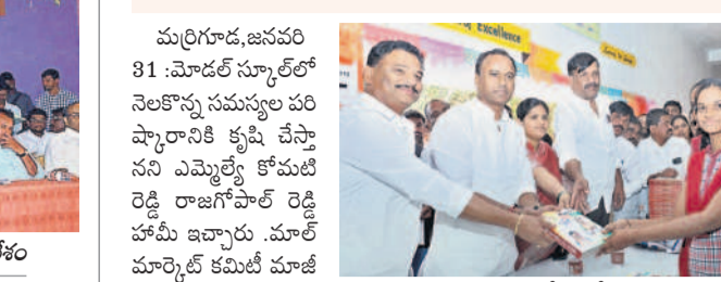
విద్యార్థులకు ప్రడీ మెటీరియల్ను అందజేస్తున్న ఎమ్మెల్యే కోమటిరెడ్డి రాజగోపాల్ రెడ్డి

మిర్యాలగూడ, జనవరి 31 : మోడల్ స్కూల్లో నెలకొన్న సమస్యల పరిష్కారానికి కృషి చేస్తానని ఎమ్మెల్యే కోమటి రెడ్డి రాజగోపాల్ రెడ్డి హామీ ఇచ్చారు. మోడల్ స్కూల్లోని సమస్యలపై మెటీరియల్ను అందజేస్తున్న ఎంపీ మెండలంలో సమస్యలను పరిష్కరించాలని కోరగా త్వరలోనే పరిష్కరించేందుకు చర్యలు తీసుకుంటామన్నారు. విద్యార్థులు కట్టడం చేసిన మంది మార్కులు సాధించాలని సూచించారు. అలాగే కన్వెన్యూగాండ్ బాలికల విద్యాలయం బోధన నిర్వహించే పాఠశాలలో హాళిక పనులు లేక బాలికలు ఇబ్బందులు పడుతున్నారని ఎమ్మెల్యేకు వివరాల తెలిపారు.