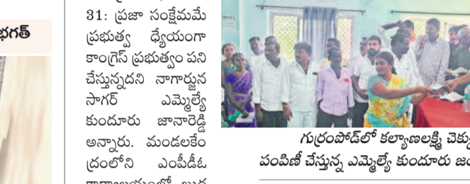
గుర్రంపాడోలో కల్యాణలక్ష్మి చెక్కులు పంపిణీ చేస్తున్న ఎమ్మెల్యే కుందూరు జయవీర రెడ్డి

గుర్రంపాడో, జనవరి 31 : ప్రజా సంక్షేమమే ప్రభుత్వ ధ్యేయంగా కాంగ్రెస్ ప్రభుత్వం పని చేస్తున్నదని నాగార్జున సాగర్ ఎమ్మెల్యే కుందూరు జయవీరరెడ్డి అన్నారు. మండల కేంద్రంలోని ఎం.పీ.డి. కార్యాలయంలో బుధవారం కల్యాణలక్ష్మి చెక్కులు పంపిణీ చేసి మాట్లాడారు. కాంగ్రెస్ ప్రభుత్వం ప్రజలకు ఇచ్చిన అన్ని హామీలను అమలు చేస్తుందని అన్నారు. అంతకుముందు మండలంలోని తానెంపాడోలో జిల్లా స్థాయి క్రికెట్ పోటీలను ప్రారంభించారు. కార్యక్రమంలో ఎం.పీ