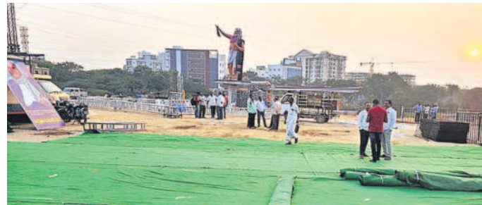
తెల్లూపూర్లో చకచకా జరుగుతున్న గడ్డర్ విగ్రహ అభివృద్ధి ఏర్పాటు పనులు