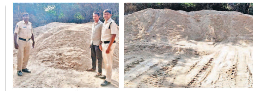
సోమవారం సీజ్ చేసిన ఇసుక డంపులు, మంగళవారం ఖాళీ అయిన ఇసుక

కొత్తకోట, జనపరిషత్ కార్యక్రమంలో పాల్గొని ప్రధాన అతిథిగా పాల్గొన్నారు. గాంధీజీ విగ్రహం వద్ద నివాళులర్పించారు. ఈ సందర్భంగా ఆయన మాట్లాడుతూ గాంధీజీ తన పరి