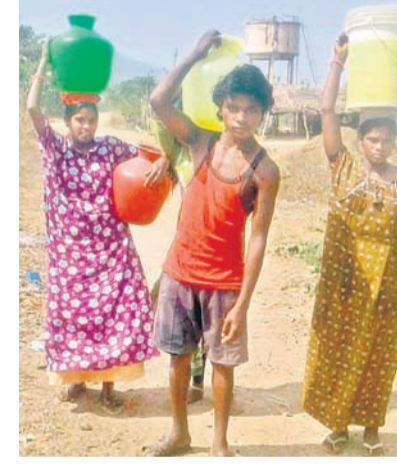
బీదెల్లో నీటిని తెచ్చుకుంటున్న చెంచులు

అవయవదానం చేసిన కుటుంబ సభ్యులు నాగర్ కర్నూల్ టౌన్, జనపరిషత్ కార్యక్రమంలో పాల్గొని ప్రధాన అతిథిగా పాల్గొన్నారు. గాంధీజీ విగ్రహం వద్ద నివాళులర్పించారు. ఈ సందర్భంగా ఆయన మాట్లాడుతూ గాంధీజీ తన పరి