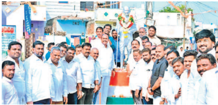
గాంధీజీ విగ్రహం వద్ద నివాళులర్పిస్తున్న ఎమ్మెల్యే బండ్ర