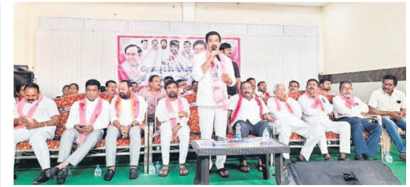
మాట్లాడుతున్న మాజీ మంత్రి వేముల ప్రశాంత్ రెడ్డి