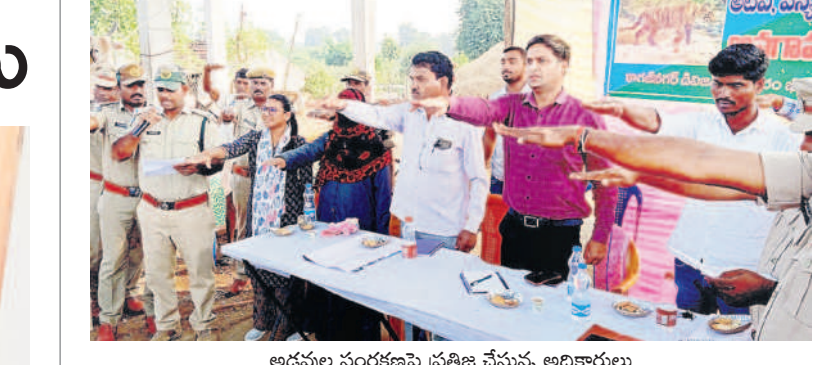
అడవుల సంరక్షణపై ప్రతిజ్ఞ చేస్తున్న అధికారులు