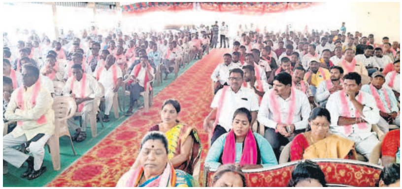
సమావేశంలో పాల్గొన్న నాయకులు, కార్యకర్తలు

ఎన్నికల కోడ్ పేరిట తప్పించుకునే యత్నం చేస్తే పోరాటం తప్పదు