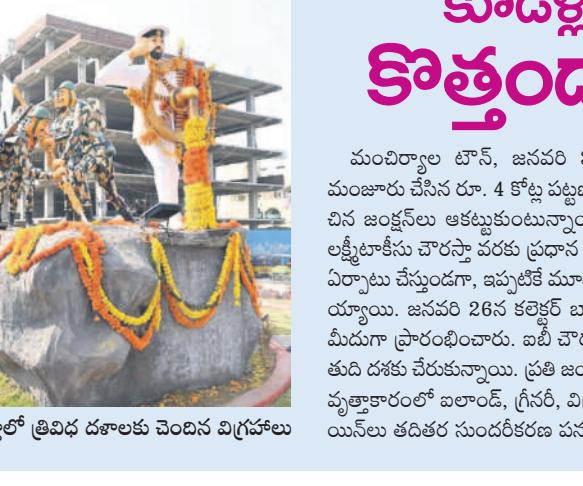
బెల్లంపల్లి చౌరస్తాలో త్రివిధ దశాలకు చెందిన విగ్రహాలు