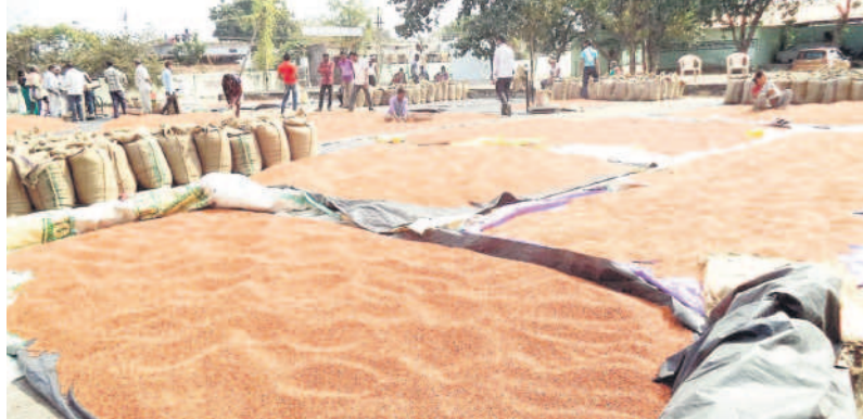
కేసీఆర్ ప్రభుత్వంలో కందుల కొనుగోళ్లతో కళకళలాడుతున్న మార్కెట్ యార్డు (ఫైల్)

వేలకు పైనే పలుకుతున్నది. కాగా, కందుల కొనుగోళ్లు ఎందుకు ప్రారంభించడం లేదంటూ సోమవారం జరిగిన జడ్జి సమావేశంలో అధికారులను ప్రశ్నించగా, సమాధానం దాటవేశారు.