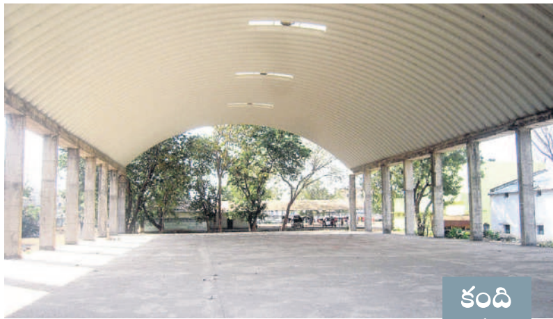
ప్రస్తుతం కొనుగోళ్లలోక వెలవెలతున్న మార్కెట్ యార్డు