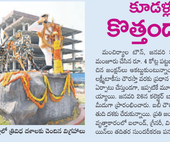
బెల్లంపల్లి చౌరస్తాలో త్రివిధ దూలకు చెందిన విగ్రహాలు

పుతున్నాయి. ట్రాఫిక్ సిగ్నల్ వ్యవస్థలో పనిచేయడానికి వాహనాలు ముందుకు వెళ్లాలి అంటూ నిర్దేశించారు. ఐటీ చౌరస్తాలో రాజ్యాంగ నిర్మాత అంబేద్కర్ విగ్రహంతో పలు పురుషులు విగ్రహాలను ఏర్పాటుచేయనున్నారు. టీటీడీ కల్యాణ మండలం చౌరస్తా వద్ద ఫౌంటెయిన్ పాలు గ్రీనరీ ఏర్పాటు చేశారు. బెల్లంపల్లి చౌరస్తాలో త్రివిధ దూలకు సంబంధించిన విగ్రహాలు, జాతీయ పతాకం, దేశభక్తిని చాటే సమావాలను ఏర్పాటు చేశారు. లక్ష్మీటాకీ చౌరస్తాలో ప్రక్క అతి సంబంధించిన ఆకృతితో ఉన్న పాదచాటి ప్రతిమ, దానికింద ఆయా కులవృత్తుల వారి సమావాలను ఏర్పాటు చేశారు. ఈ జంక్షన్ల నిర్మాణంతో మంచిర్యాల పట్టణం సరికొత్త కోభంతరించుకున్నది.