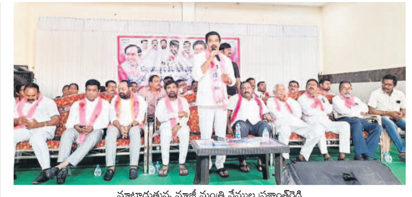
మాట్లాడుతున్న మాజీ మంత్రి వేముల ప్రశాంత్ రెడ్డి