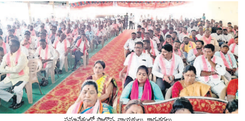
సమావేశంలో పాల్గొన్న నాయకులు, కార్యకర్తలు