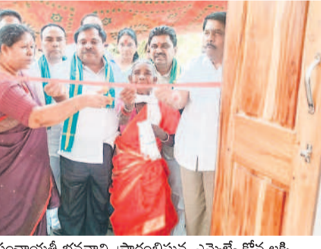
గోవిందపూర్లో పంచాయతీ భవనాన్ని ప్రారంభిస్తున్న ఎమ్మెల్యే కోవ లక్ష్మి