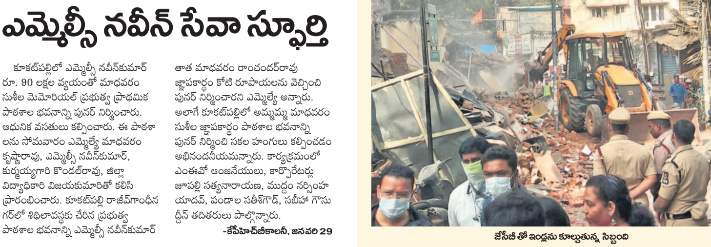
జీసీబీ తో ఇండ్లను కూల్చుతున్న సిబ్బంది