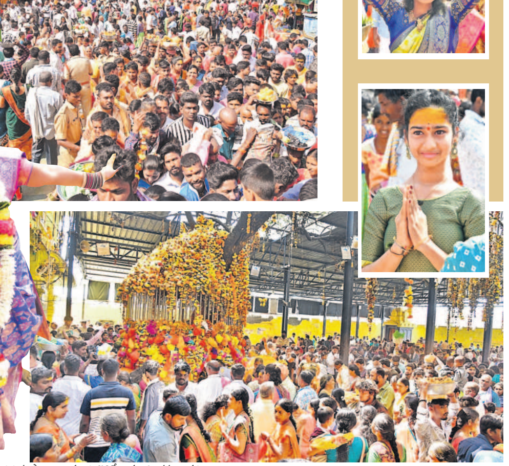
శివమూర్తి అలయ గంగారేని చెట్టు వద్ద భక్తుల మొక్కులు