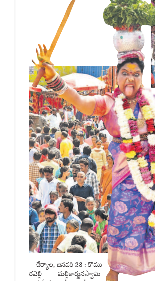
వివిధ ప్రాంతాల నుంచి 50వేల మంది భక్తులు వచ్చినట్లు అలయ ఈవో బాలాజీ తెలిపారు.