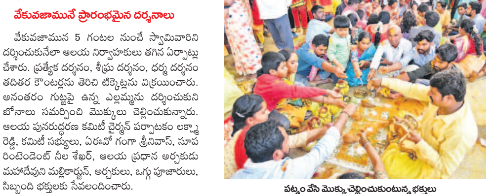
పట్నం వీణ మొక్కు చెల్లించుకుంటున్న భక్తులు