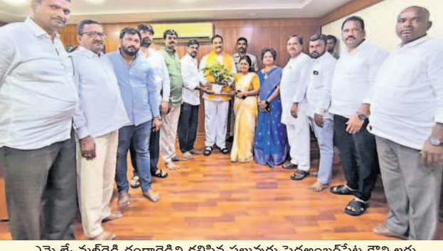
ఎమ్మెల్యే మల్లారెడ్డి రంగారెడ్డిని కలిసిన పలువురు పెద్దఅంబరపేట కౌన్సిలర్లు

ఎమ్మెల్యే మల్లారెడ్డి రంగారెడ్డిని కలిసిన ఓ వర్గం కౌన్సిలర్లు