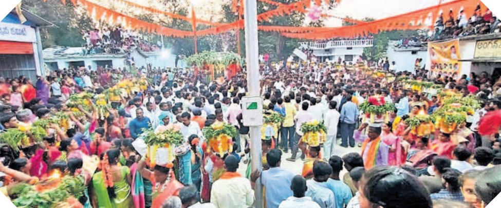
ఊరడమ్మ జాతరలో పాల్గొన్న ప్రజలు, భక్తులు

పెద్దేమూర్, జనవరి 28 : మండల పరిషత్లోని మంబాపూర్లో ఆదివారం గ్రామ దేవత ఊరడమ్మ పండుగను అంగరంగ వైభవంగా నిర్వహించారు. ఉత్సాహాల్లో భాగంగా ప్రజలందరూ ఉదయాన్నే స్నానాలాచరించారు. బంధుమిత్రులను ఆహ్వానించి పిండి వంటలు వండుకొని భోజనాలు చేశారు. సాయంత్రం గ్రామంలో అన్ని ఇండ్ల నుంచి మహిళలు, యువకులు పెద్దపెత్తన బోనాలు, వైవేద్యాలను తయారుచేసుకొని గ్రామ ప్రధాన వీధుల గుండా ఊరేగింపుగా వెళ్లి ఊరడమ్మ అమ్మవారికి సమర్పించి మొక్కులు చెల్లించుకున్నారు. ఊరేగింపులో శివసత్తుల పూసకాలు, పోతరాజు విగ్రహాలు, ఏర్పాటు చేసిన భవ్యవాహినీ అందరినీ ఆకట్టుకున్నాయి. ప్రజలు, బంధువులతో ఊరంతా సందడిగా మారింది.