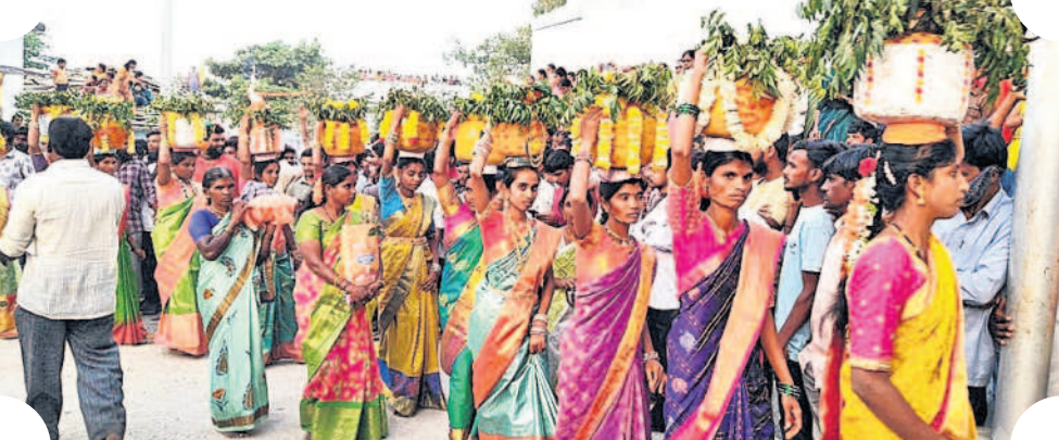
అమ్మవారికి బోనాలను సమర్పించడానికి ఊరేగింపుగా వెళ్తున్న మహిళలు, యువకులు

ద్గర్ విగ్రహానికి పూలమాలలు వేసి నివాళులర్పించారు. కార్యక్రమంలో జడ్పీటీసీలు, ఎంపీటీసీలు, సర్పంచులు, ఎంపీటీసీలు, ఆదికారులు, మండల నాయకులు పాల్గొన్నారు.