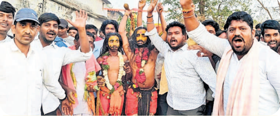
జాతరలో పాతరాజులతో స్థానిక యువకుల ఉత్సాహం