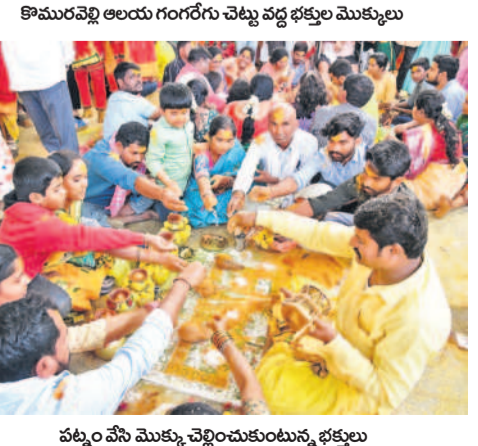
పట్నం వేసి మొక్కు చెల్లించుకుంటున్న భక్తులు