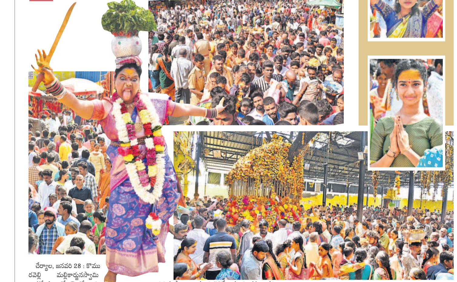
వివిధ ప్రాంతాల నుంచి 50వేల మంది భక్తులు వచ్చి పట్టు అలయ ఈవో బాలాజీ తిలిపారు.

చేర్యాల, జనవరి 28 : కొమ్మ రవెల్లి మల్లికార్జునస్వామి బ్రహ్మోత్సవాల్లో రెండో ఆదివారం యల్వేరవారం సందర్భంగా మల్లన్న క్షేత్రానికి భక్తులు భారీగా తరలివచ్చారు. హైదరాబాద్ పాటు కరీంనగర్, మెదక్, వరంగల్ ఉమ్మడి జిల్లాలకు చెందిన భక్తులు స్వామివారిని దర్శించుకున్నారు. మల్లన్న స్వామి మమ్మేలు అంటూ నినాదాలతో అలయ పరిసరాలు మోగొగాయ. శనివారం సాయంత్రం నుంచే ఆర్డీసీ బస్సులు, ప్రైవేటు వాహనాల్లో భక్తులు మల్లన్న క్షేత్రానికి చేరుకున్నారు. అలయ పరిధిలో దాతల గదులు ఖాళీగా లేకపోవడంతో ప్రైవేటు గదులు కిరాయికి తీసుకుని బస చేశారు. ఆదివారం వేడుక జాషుసీ నిద్రలేచి కోనేటిలో స్నానాలు ఆచరించి క్యూలో వెళ్లి మల్లన్నస్వామిని దర్శించుకున్నారు. అభిషేకం, అర్చన, ఒడి బియ్యం, కొబ్బరికాయలు, పట్నాలు, బోనాలు చేసి మొక్కులు చెల్లించుకున్నారు.