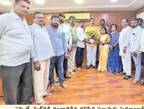
ఎమ్మెల్యే మల్లారెడ్డి రంగారెడ్డిని కలిసిన పలువురు పెద్దఅంబరపేట కౌన్సిలర్లు

ఎమ్మెల్యే మల్లారెడ్డి రంగారెడ్డిని కలిసిన ఓ వర్గం కౌన్సిలర్లు