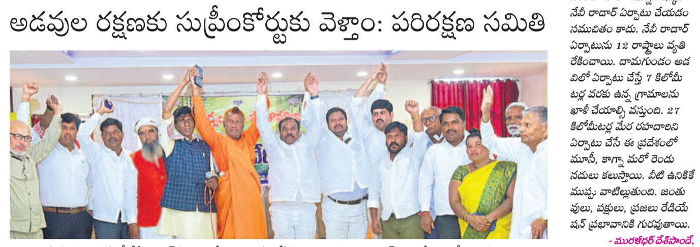
దామగుండం అడవిలో నేటి రాదార్ ఏర్పాటు చేయడాన్ని వ్యతిరేకిస్తూ అదివారం వికారాబాద్ జిల్లా కేంద్రంలో పరిరక్షణ సమితి అధ్యక్షులు జరిగిన చర్యవేదికలో పాల్గొన్న చర్యచరణవేత్తలు, ప్రజాసంఘాల నభ్యులు, రాజకీయ వర్గాల నేతలు

దామగుండం అడవి రక్షణకు సుప్రీంకు వెళ్తాం పది రోజుల్లో సుప్రీంకోర్టులో పిటిషన్ వేస్తాం ప్రకృతి విధ్వంసంపై ఎన్టీసీని ఆశ్రయిస్తాం చర్చా వేదికలో పరిరక్షణ సమితి సృష్టికరణ భవిష్యత్తు ఉద్యమ కార్యచరణ ఖరారు కలెక్టరేట్ ముట్టిడి.. జిల్లా బండ్పైనా చర్చ వికారాబాద్, జనవరి 28 (నమస్తే తెలంగాణ): వికారాబాద్ జిల్లా పూడూరు మండలం లోని దామగుండం రిజర్వ్ ఫారెస్టులో పీఎల్ఎఫ్ రాదార్ ఏర్పాటుకు వ్యతిరేకంగా ఉద్యమం కదిలింది. నాలుగు నడులకు పుట్టినిల్లు అయిన దామగుండంలో రాదార్ కేంద్రాన్ని ఏర్పాటు చేయొద్దని ప్రజాసంఘాలు, మేధావులు, పార్టీల నాయకులు, అధ్యక్షులు, ప్రకృతి ప్రేమికులు ముక్తకంఠంతో డిమాండ్ చేశారు. తమ ప్రాంత భవిష్యత్తు ప్రశ్నార్థకమయ్యే రాదార్ ఏర్పాటుకు వ్యతిరేకంగా పాత్రికేయకంగా పోరాడునామని >3వ పేజీలో