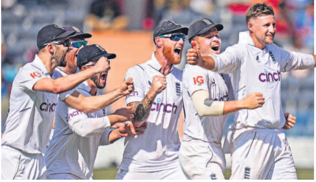
తొలి రెండు రోజులు కనీసం పోటీలో కూడా లేని ఇంగ్లండ్.. అద్భుతీయ పోరాటంతో అద్భుత విజయం సాధించింది. తొలిటెస్టులో ఇంగ్లండ్ చేతిలో భారతకు భంగపాటు తప్పలేదు. రెండో ఇన్నింగ్స్లో తన బౌలింగ్తో అదరగొట్టిన హార్టీ.. ఏడు వికెట్లతో భారత్పై చెలరేగిపోయాడు. >12