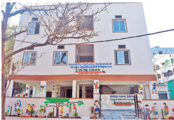
కూకట్‌పల్లిలో సోమవారం ప్రారంభించనున్న మాధవరం సుశీలమ్మ మెమోరియల్ ప్రభుత్వ ప్రాథమిక పాఠశాల