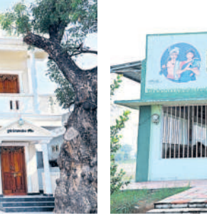
కోరింలో చెన్నాడి కుటుంబం వితరణ చేసిన స్థలంలో నిర్మించిన రైతు వేదిక