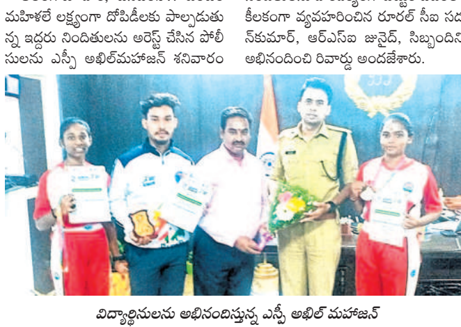
విద్యార్థులను అభినందిస్తున్న ఎన్సీ అఖిల మహిళా