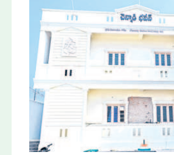
కోరింలో చెన్నాడి కుటుంబం వారు సొంత ఖర్చులతో నిర్మించిన గ్రామపంచాయతీ కార్యాలయం