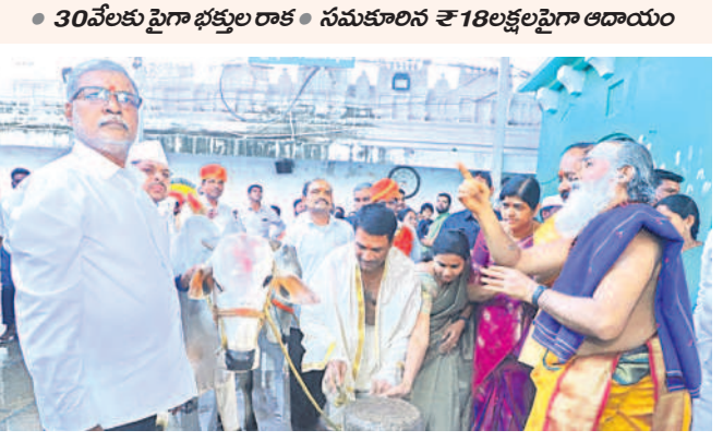
కోడిమొక్క చెల్లించుకుంటున్న న్యాయమూర్తి మూడవలలో