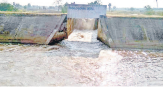
గూడెం ఎత్తిపోతల నుంచి కడెం కాలువలోకి వస్తున్న నీరు

120 రోజుల నుంచి 135 రోజుల్లో వేతి వచ్చే స్వల్పకాలిక రకాలైన సాంధ్యం, చిట్టిపాటి, అంకూర్ 101, జైత్రరాం తదితర రకాలను సాగు చేస్తున్నారు.