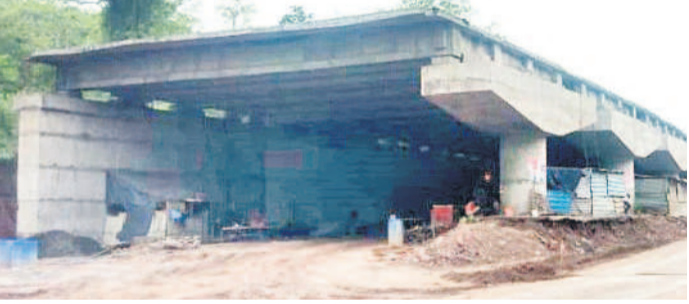
వాంకీడి మండలంలో శరవేగంగా సాగుతున్న పర్యావరణ వంతెన నిర్మాణం

కుమ్రం ఖిం అసిఫాబాద్, జనవరి 27 (నమస్తే తెలంగాణ) : మంచిర్యాల-చంద్రాపూర్ వరకు చేపడుతున్న జాతీయ రహదారి విస్తరణ పనులతో పులులు, ఇతర వన్యప్రాణులు అలంకార ప్రత్యేక చర్యలు చేపడుతున్నది. అటవీసంతులన తరచూ రోడ్డు దాటి ప్రాంతాలను గుర్తించి.. ఆయా ప్రదేశాల్లో పర్యావరణ వంతెనలను శరవేగంగా నిర్మిస్తున్నది.