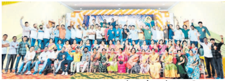
అపూర్వ సమ్మేళనం అపూర్వ సమ్మేళనంలో సరస్వతీ శిశుమందిర విద్యార్థులు

రామకృష్ణపూర్, జనవరి 27 : క్యాంపస్ పల్లె మున్సిపాలిటీలోని శ్రీ సరస్వతీ శిశుమందిర ఉన్నత పాఠశాలకు చెందిన 1997-1998 బ్యాచ్ పదో తరగతి విద్యార్థులు శనివారం ఒకే వేదికపై కలుసుకున్నారు. శ్రీనివాస గార్డెన్ లో అపూర్వ సమ్మేళనంలో నిర్వహించి, చిన్ననాటి జ్ఞాపకాలను సమర్పించుకున్నారు. తమకు విద్యా బుద్ధులు నేర్పిన గురువులను ఘనంగా సన్మానించారు. అనంతరం అందరూ కలిసి భోజనం చేశారు.