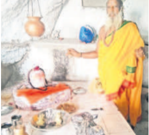
ఆలయంలో పూజలు చేస్తున్న పూజారి భూమయ్య

జన్మరం, జనవరి 27 : మండల కేంద్రంలోని పాపకర్ గ్రామ శివారు గల పీర్ గుట్టపై వెలిసిన కేతేశ్వర-కంకాలమ్మ జాతరను ఈ నెల 28న నిర్వహించనున్నట్లు ఆలయ కమిటీ సభ్యులు తెలిపారు. జాతరకు వచ్చే భక్తుల కోసం అన్ని సౌకర్యాలు కల్పించినట్లు పేర్కొన్నారు. ఉమ్మడి అదిలాబాద్, హైదరాబాద్, నిజామాబాద్, కరీంనగర్, వరంగల్ జిల్లాల నుంచి పెద్ద సంఖ్యలో భక్తులు తరలి వచ్చి మొక్కులు తీర్చుకుంటారని వారు తెలిపారు. అలాగే ఇక్కడి శివాలయం వార్షికోత్సవం సందర్భంగా భక్తులు ప్రత్యేక పూజలు చేయనున్నట్లు, అన్నదానం నిర్వహించనున్నట్లు తెలిపారు.