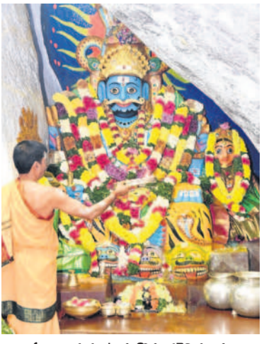
పూజలందుకుంటున్న కొమ్మరవెల్లి మల్లన్న