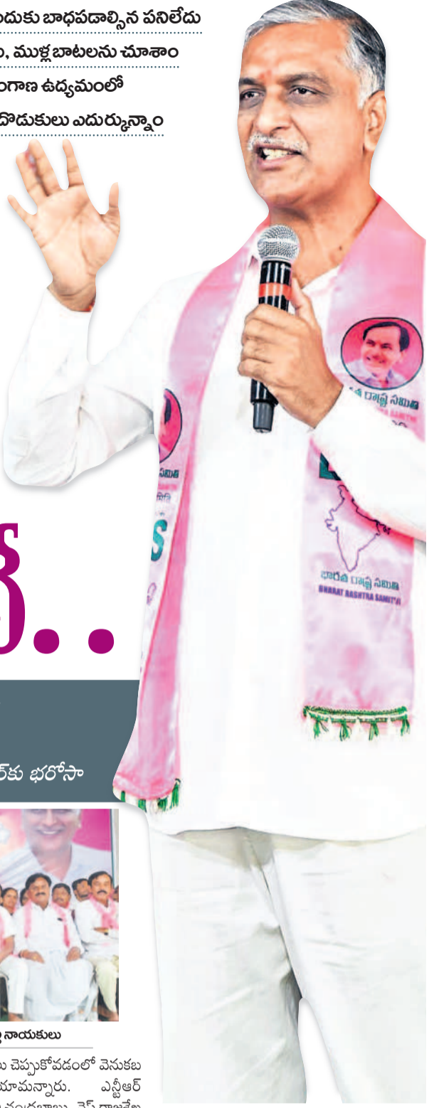
సిద్దిపేట బీఆర్ఎస్ కృతజ్ఞత సభలో మాట్లాడుతున్న మాజీ మంత్రి, ఎమ్మెల్యే హరిశ్చంద్రావు

నిజం నిలకడగా ఉంటుంది. మనల్ని కొన్ని యూట్యూబ్ చానళ్లు కొంప ముంచాయని హరిశ్చంద్రావు ఆరోపించారు. గడప దాటక ముందే అబద్ధం ఊరతా చట్టే వస్తుందన్నారు. మనం చేసిన మంచి