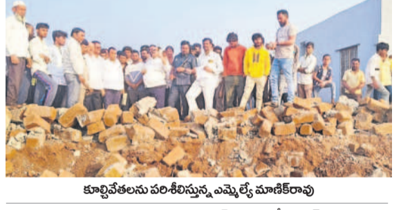
కూల్చివేయబడిన పరిశీలనను ఎమ్మెల్యే మాజీ కలిక్టర్

వేదల రేకుల షెడ్యూ, ప్రవారీ కూల్చివేయడం ద్వారాం కేసీఆర్ ప్రభుత్వం ఇచ్చిన హామీలను విప్పే లంపిన అధికారులు జిహారాబాద్ ఎమ్మెల్యే మాజీ కలిక్టర్ పటానా స్థలం పరిశీలన, బాధితులకు భరోసా