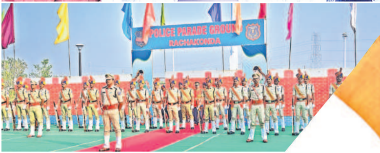
రాజకొండ పోలీస్ పరేడ్ గ్రౌండ్లో పోలీసుల మార్చ్ పాస్ట్రాన్