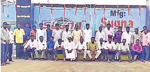
శుక్రవారం సుగుణ స్ట్రీట్ కంపెనీ ఎదుట ఆందోళన చేస్తున్న రైతులు

పరిగి టౌన్, జనవరి 26: కంపెనీ పాల్యుషన్ తో తమ పంటలు నాశనంపడుతున్నాయని లక్ష్మీదేవిపల్లి గ్రామానికి చెందిన రైతులు సుగుణ స్ట్రీట్ కంపెనీ ఎదుట శుక్రవారం ధర్నాకు దిగారు. సమస్యను పరిష్కరించాలని అధికారులు, ప్రజాపతినిధులకు ఎన్ని సార్లు విన్నవించినా పట్టించుకోవడం లేదన్నారు. కంపెనీ కాలనీలతో పంటలు పూర్తిగా దెబ్బతిని ఆర్థికంగా నష్టపోతున్నామని.. పరిహారం చెల్లించి అదుకోవాలని ఆందోళన చేపట్టారు. కంపెనీలోకి వాహనాలు వెళ్ళకండా గేటు ఎదుట ఆడ్డుకున్నారు. కంపెనీ నిర్వాహకులు రైతులను సముదాయించే ప్రయత్నం చేసినా వారు వినిపించుకోలేదు. సమస్యను పరిష్కరించే వరకూ ఆందోళన చేపడుతామని హెచ్చరించారు.