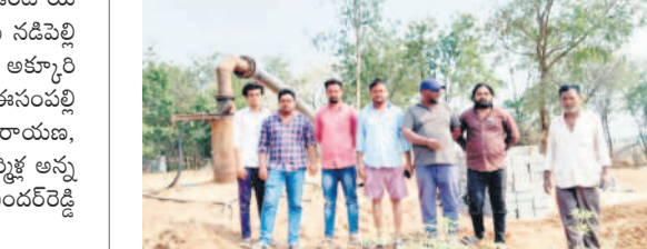
మాట్లాడుతున్న దుబ్బుగూడెం గ్రామస్థులు

కాసిపేట, జనవరి 26 : సింగరేణి ఓపెన్ క్యాస్ నిర్మాణ గ్రామస్థులకు ఉద్యోగావకాశాలు కల్పించాలని పలువురు డిమాండ్ చేశారు. శుక్రవారం దుబ్బుగూడెం జిల్లాలోని బోర్ పనులను అడ్డుకున్నారు. ఈ సందర్భంగా గ్రామస్థులు మాట్లాడుతూ సింగరేణి అధికారులు ఓపెన్ క్యాస్ ఉద్యోగాలు కల్పిస్తామని హామీ ఇచ్చి మామిడి అవుతుందని, అధికారుల చుట్టూ తిరిగి పట్టించుకోవడం లేదని మండిపడ్డారు. ఇకపై న్యాయం చేయాలని, లేదంటే ఓపెన్ క్యాస్ అడ్డుకుంటామని హెచ్చరించారు.