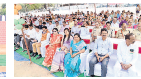
వేడుకలకు హాజరైన అధికారులు