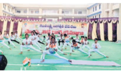
ఆసిఫాబాద్ : నృత్యం చేస్తున్న చిన్నారులు