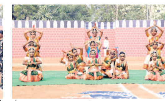
నృత్యం చేస్తున్న విద్యార్థినులు