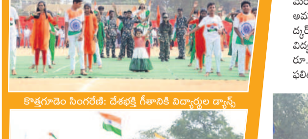
కొత్తగూడెం సింగరేణి: దేశభక్తి గీతానికీ విద్యార్థుల డ్యాన్స్