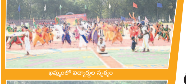
ఖమ్మంలో విద్యార్థుల నృత్యం