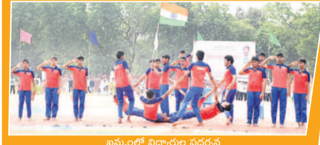
ఖమ్మంలో విద్యార్థుల ప్రదర్శన

రేణి ఆంధ్రప్రదేశ్, కర్ణాటక, మహారాష్ట్ర, తమిళనాడుతో సహా దేశ వ్యాప్తంగా ఉన్న దాదాపు 20 పెద్ద ధర్మల్ విద్యుత్ కేంద్రాలకు బోస్ సరఫరా చేస్తుందన్నారు. తద్వారా లక్షలాది మిలియన్ యూనిట్ విద్యుత్ అవుతుందని, ఆ విద్యుత్ దేశాభివృద్ధికి తోడ్పడుతుందన్నారు. సంస్థ కార్యదర్శి, డిప్యూటీ సీఎండీ ఉద్దేశ్యాలలో పాటు నిరుద్యోగులైన కార్మికుల పిల్లలకు అనేక రకాల ఉపాధి శిక్షణ ఇస్తున్నామన్నారు. సంస్థ గడించిన ఆదాయంలో కార్మికులకు బోనస్ ఇస్తున్నామన్నారు. సంస్థ పరిధిలో వచ్చే ఏడాది మరో నాలుగు కొత్త గనులను ప్రారంభిస్తామన్నారు. అనంతరం ఉత్తమ సింగరేణి యజ్ఞను సీఎండీ సన్మానించారు. తర్వాత విద్యార్థుల సాంస్కృతిక కార్యక్రమాలు ఆంధ్రం అవకాశమన్నారు.