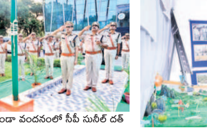
మామిళ్లగూడెం: జిందా వందనంలో సీపీ సునీల్ దత్త