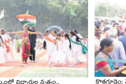
ఖమ్మంలో విద్యార్థుల నృత్యం..