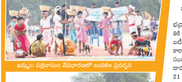
ఖమ్మం: పల్లెవాసుల వేవధారణలో బుడతల ప్రదర్శన