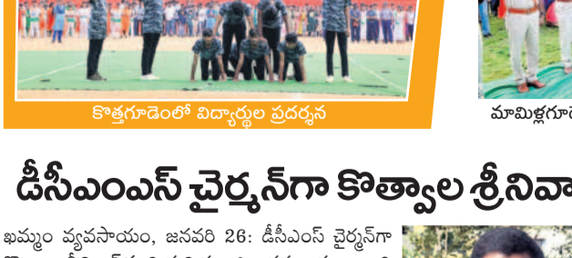
కొత్తగూడెంలో విద్యార్థుల ప్రదర్శన