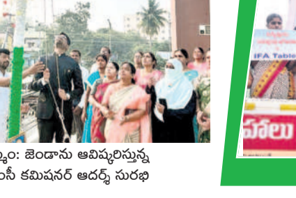
ఖమ్మం: అకట్టుకున్న వైద్యారోగ్యశాఖ శకటం