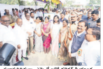
ప్రజాప్రతినిధులు, ఎమ్మెల్యేలతో కలెక్టర్ ప్రయాంక