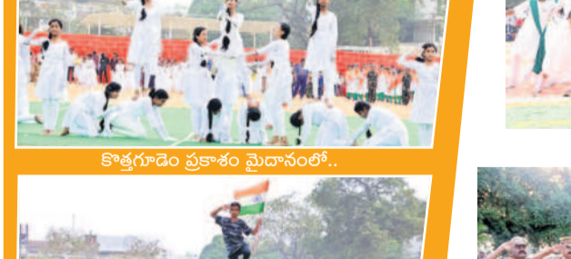
కొత్తగూడెం ప్రకాశం మైదానంలో..