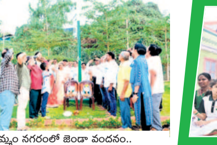
ఖమ్మం నగరంలో జిందా వందనం..