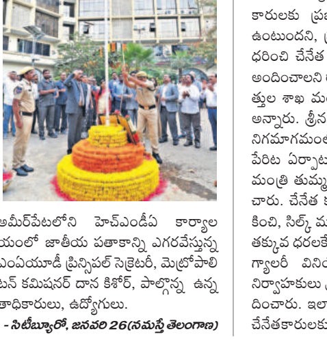
అమీర్ పేటలోని హెచ్ఎంపీ కార్యాలయంలో జాతీయ పతాకాన్ని ఎగురవేస్తున్న ఎంపీ యూడీ ప్రీతిపల్ సెన్లెటర్, మెట్రిపాలిటన్ కమిషనర్ దాన కిశోర్, పాల్గొన్న ఉన్నతాధికారులు, ఉద్యోగులు. - సిటీబ్యూరో, జనవరి 26 (నమస్తె తెలంగాణ)