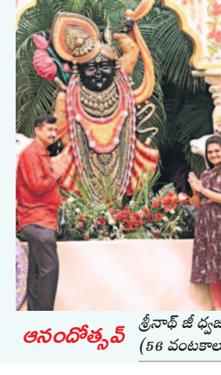
ఆనందోత్సవం శ్రీనాథ్ డిప్యూటీ ఆరోహణ ఉత్సవం సమితి ఆధ్వర్యంలో శుక్రవారం రాత్రి నెక్లెన్ రోడ్లోని జల విహారంలో ఏర్పాటు చేసిన ఆనంద ఉత్సవం వందనగా సాగింది. ఈ సందర్భంగా శ్రీకృష్ణుడికి చప్పన బోగ్ (58 వంటకాలు)లను నిర్వాహకులు సమర్పించారు. ఈ వేడుకలకు ముఖ్య అతిథిగా హాజరైన రాష్ట్ర ఉప ముఖ్యమంత్రి మల్లు భట్టి విక్రమార్కుకు నిర్వాహకులు జ్ఞాపికను అందజేశారు. - ఖైరతాబాద్