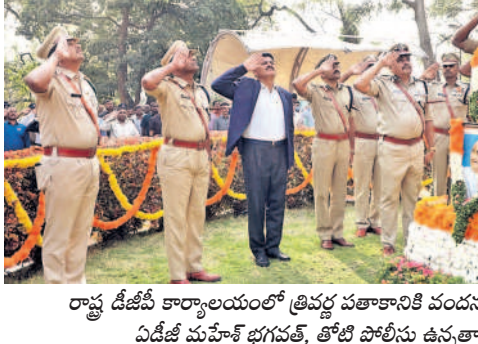
రాష్ట్ర డీజీపీ కార్యాలయంలో త్రివర్ణ పతాకానికి వందన సమర్పణ చేస్తున్న ఏడీజీ మహేశ్ భగవత్, తోటి పోలీసు ఉన్నతాధికారులు