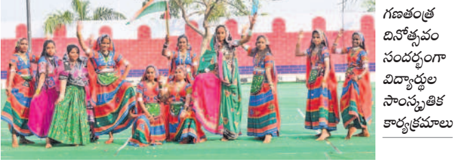
గణతంత్ర దినోత్సవం సందర్భంగా విద్యార్థుల సాంస్కృతిక కార్యక్రమాలు