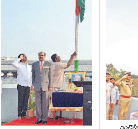
యాంటి కరప్షన్ బ్యూరో కార్యాలయంలో జాతీయ పతాకానికి సెల్యూట్ చేస్తున్న ఆ శాఖ డీజీ సీపీ ఆనంద్