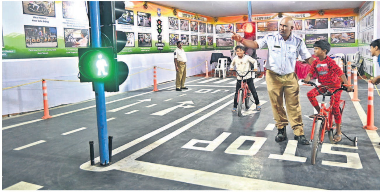
రూల్స్ పాటిస్తే.. క్షేమంగా చేరుకుంటాం | నుమాయిషీలోని ట్రాఫిక్ సైట్లో శుక్రవారం చిన్నారులకు అవగాహన కల్పిస్తున్న సిబ్బంది