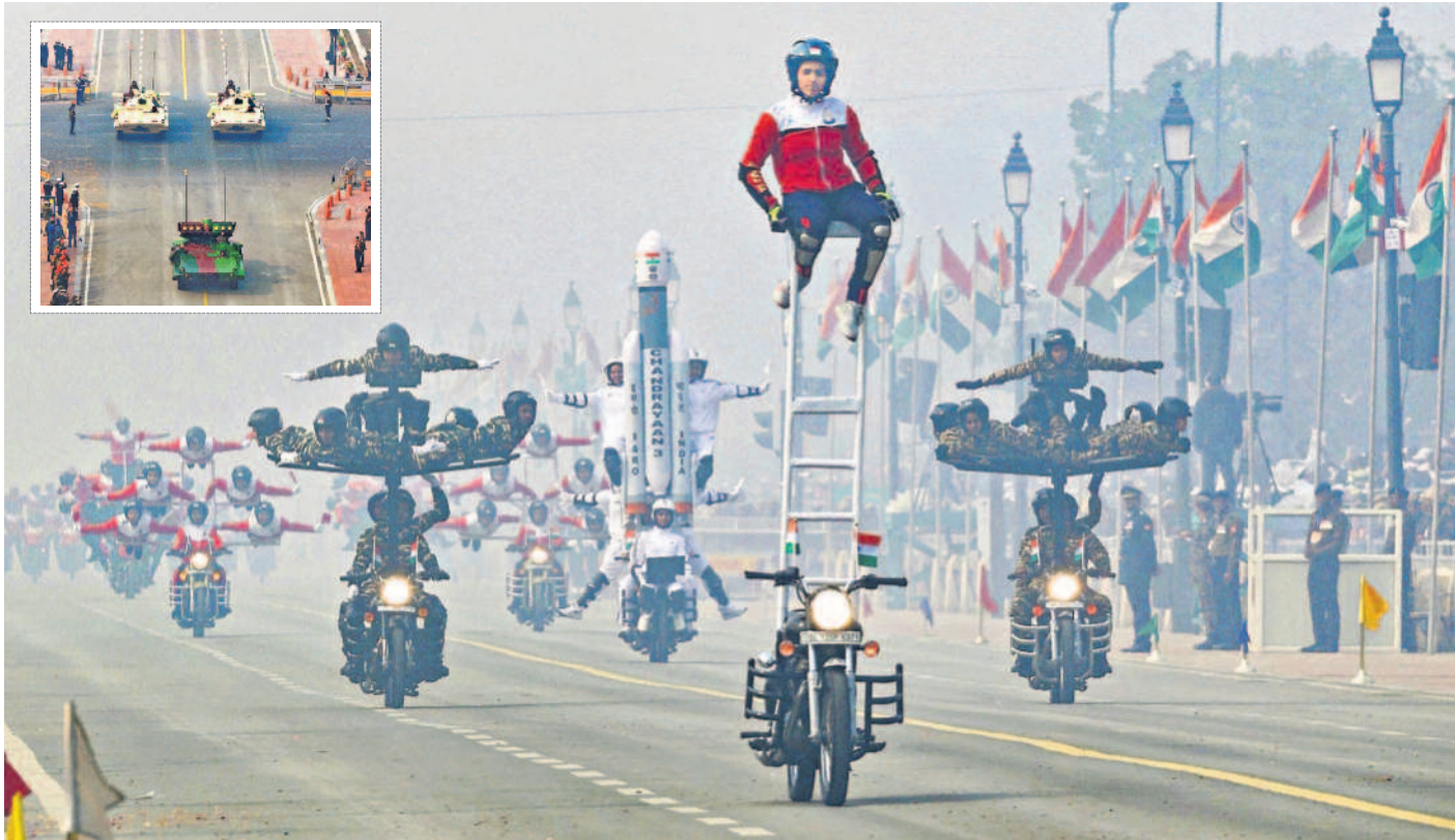
లబ్ధి కే కవాతులో భారత అత్యధిక చెందిన డేర్ డెవిల్స్ మహిళల బృందం సాహసోపేత ప్రదర్శనలు (ఇన్ సైట్లో అత్యధిక చెందిన యుద్ధ ట్యాంకులు)