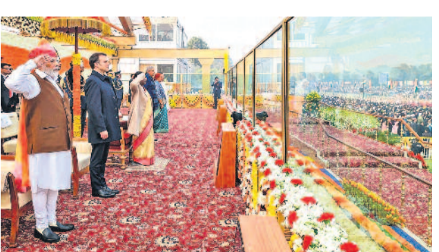
లబ్ధి కే కవాతులో సైనిక దళాల నుంచి వందల సంఖ్యలో ఉన్న రాష్ట్రపతి ముద్ర, ప్రధాని మోదీ, కవాతును తెలిపే ప్రాన్స్ అధ్యక్షుడు మెక్రాన్