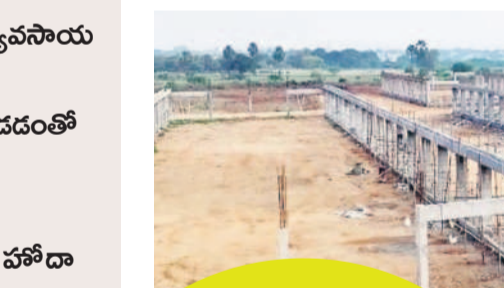
మద్దులపల్లి వ్యవసాయ మార్కెట్

సాధారణంగా వ్యవసాయ మార్కెట్ పరిధిలోని జిసింగింగి మిల్లులు, సైటిఫికెడ్ గోడౌన్లు, కోల్డ్ స్టోరేజీలు, డ్రైవింగ్ లు, వెక్టిఫోన్లు మొత్తం సడద మార్కెట్ పరిధిలోకి వస్తాయి. మార్కెట్ జరిగిన క్రయవిక్రయాలకు సంబంధించిన ఆదాయంతోపాటు ఇతర వనరుల నుంచి వస్తున్న సైతం ఆ మార్కెట్ ట్రిబ్యునల్ జమకావడం సర్వసాధారణం. అయితే ఖమ్మం రూరల్ మండల పరిధిలోని మద్దులపల్లి వ్యవసాయ మార్కెట్ విషయంలో ఇందుకు భిన్నమైన పరిస్థితి కనపడుతున్నది.