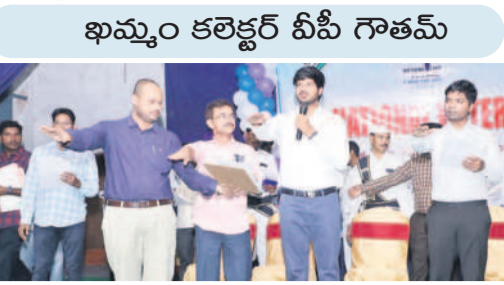
ప్రతిజ్ఞ చేయిస్తున్న కలెక్టర్ వీవీ గౌతమ్

మామిళ్లగూడెం, జనవరి 25 : ప్రజాయుధం లాంటి ఓటును ఎన్నికల సమయంలో పారదర్శకంగా వినియోగించుకోవాలని, మంచి పాలన అందించే వారిని ఎన్నుకోవాలని ఖమ్మం కలెక్టర్ వీవీ గౌతమ్ పిలుపునిచ్చారు.