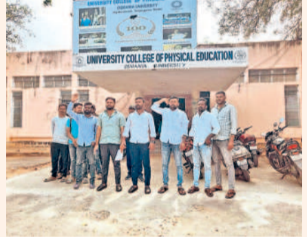
ఫిజికల్ ఎడ్యుకేషన్ కళాశాల ఎదుట ఆందోళన చేస్తున్న విద్యార్థులు