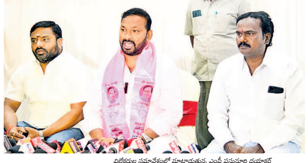
విలేజుల సమావేశంలో మాట్లాడుతున్న ఎంపీ పనులూ విడుదల చేసిన వరంగల్ లో కేసీఆర్ ప్రగతి నివేదిక