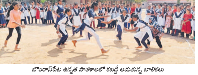
బొంబాయి: ఉన్నత పాఠశాలలో కబడ్డీ ఆడుతున్న బాలికలు

బొంబాయి, జనవరి 23: గణతంత్ర దినోత్సవాన్ని ప్రారంభించుకుని మండలంలోని ప్రభుత్వ ప్రైవేటు పాఠశాలలో విద్యార్థులకు ఆటల పోటీలు, వ్యాస రచన, ఉపన్యాస పోటీలు, క్విజ్, పాటలు, చిత్రలేఖనం తదితర పోటీలు నిర్వహిస్తున్నారు. ఆటల పోటీలలో, కబడ్డీ, ఖో-ఖో, రస్సింగ్, స్పీడ్, షాట్లు, పోటీలు నిర్వహిస్తున్నారు. విద్యార్థులు ఉత్సాహంగా పోటీలలో పాల్గొంటున్నారు. విజేతలకు ఇంకా పంపనం రోజున బహుమతులను ప్రధానం చేస్తారు. ఆటల పోటీలతో పాటు సాంస్కృతిక కార్యక్రమాలను కూడా విద్యార్థులు సాధన చేస్తున్నారు.