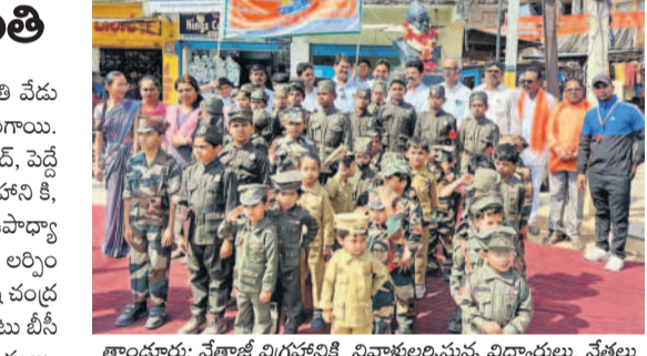
తాండూరు: నేతాజీ విగ్రహానికి నివాళులర్పిస్తున్న విద్యార్థులు, నేతలు