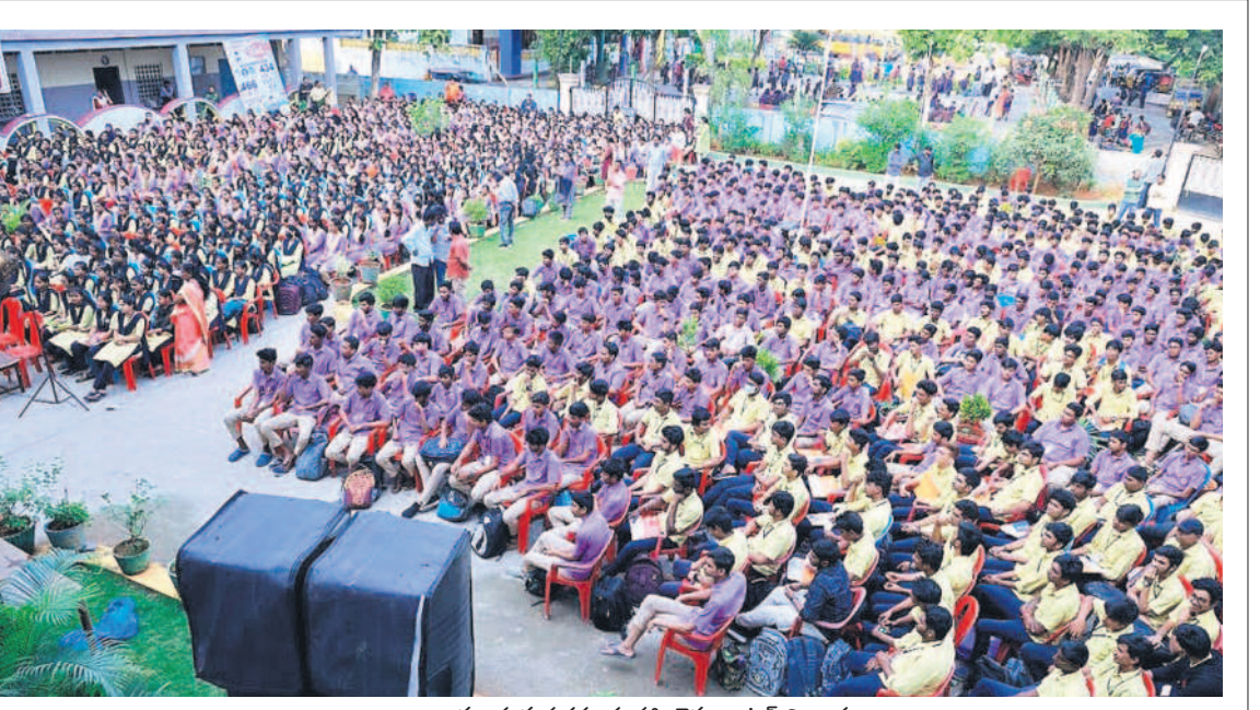
అవగాహన సదస్సు హాజరిన ఇంటర్ విద్యార్థులు