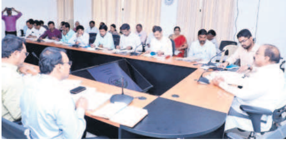
అధికారుల సమీక్షలో మాట్లాడుతున్న మంత్రి తమ్ముల నాగేశ్వరరావు

ఖమ్మం, జనవరి 23: ఖమ్మం నగరాన్ని ఆదర్శంగా తీర్చిదిద్దాలని రాష్ట్ర వ్యవసాయ శాఖ మంత్రి తమ్ముల నాగేశ్వరరావు ఆదేశించారు. పరిశుభ్ర నగరంగా పేరు తెచ్చాలని సూచించారు. ఖమ్మం నగర అభివృద్ధిపై కేఎస్ కమిటీ అధర్స్ సురభి, ఇతర అధికారులతో కలిసి కేఎస్ కార్యాలయంలో మంగళవారం నిర్వహించిన సమీక్షలో మంత్రి మాట్లాడారు. శా.ని.బి.ఎస్, టౌన్ ప్లానింగ్ సభ అన్ని విభాగాల్లో ఆదర్శంగా నిలిచేలా ఖమ్మాన్ని తీర్చిదిద్దేందుకు అధికారులు కృషి చేయాలని కోరారు. ప్రస్తుతం నగర జనాభా 4.29 లక్షలకు చేరుకుంది, 69.50 ఎంఎల్టీల విస్తీర్ణం ఉంది. గ్రాంట్ల కింద రూ.113.24 కోట్లతో 574 పనులు చేపట్టగా అందులో 488 పనులు పూర్తయ్యాయి, 19 పనులు పురోగతిలో ఉన్నాయి, 67 పనులు ఇంకా ప్రారంభించలేదని వివరించారు. పూర్తయిన పనులకు గాను ఇప్పటి వరకు రూ.24.72 కోట్లను చెల్లించినట్లు చెప్పారు. పురోగతిలో ఉన్న పనుల పూర్తికి చర్యలు వేగం చేయాలని ఆదేశించారు. సుదా