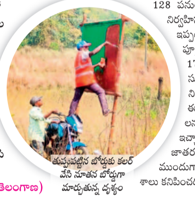
మనస్సులోని బోధకుల కల వేసి నూతన బోధగా మార్చుతున్న ధ్యక్షం