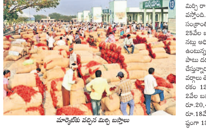
మార్కెట్కు వచ్చిన మిల్లి బస్తాలు