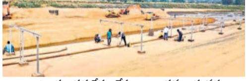
అధికారుల పర్యవేక్షణ లేకుండా జంపన్నవారి వద్ద స్నాన శుభ్రాల రివైంగ్ పనులు

టిండర్లు, 36 పనులను నామినేటివ్ పద్ధతిని కేటాయించారు. ఇవి సత్వనకన సాగుతున్నాయి. ఆర్డర్లు ఇచ్చిన ద్వారా రూ.13.45కోట్లతో 79 ప్రాంతాల్లో పనులు చేపట్టగా, ఇందులో 31 టిండర్, 42 నామినేటివ్ పద్ధతిని జరిపిస్తున్నారు. పీఆర్ శాఖ ద్వారా రూ.10.87కోట్లతో పనులు చేపట్టగా, ఇందులో 10 టిండర్, 44 నామినేటివ్ పద్ధతిని చేపట్టారు. ఈ రెండు శాఖల్లో 10శాతం కూడా పూర్తి కాలేదు. అలాగే విద్యుత్ శాఖ ఆధ్వర్యంలో రూ.11.36కోట్లతో చేపట్టగా టిండర్ ద్వారా పొందిన ఒకే ఒక్క కాంట్రాక్టర్ నెమ్మదిగా పనులు చేస్తున్నారు. విద్యుత్ శాఖ ఆధ్వర్యంలో చేపట్టిన పనులు ముందస్తుగానే చేపట్టడంతో కొన్ని ప్రాంతాల్లో పూర్తయ్యాయి. మిగిలిన ప్రాంతాల్లో వచ్చే నెల 8వ రకు పూర్తి చేసేలా ప్రణాళికలు రూపొందించారు.