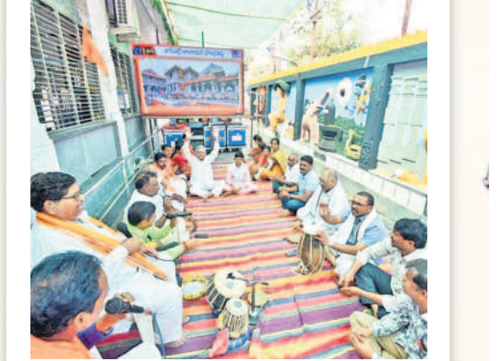
కాశీబుగ్గలోని శ్రీకాశీవిశ్వేశ్వర స్వామి దేవాలయంలో శ్రీరామజనం చేస్తున్న భక్తులు