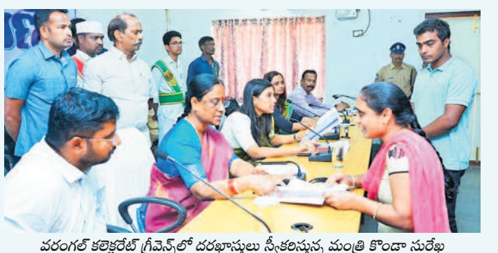
వరంగల్ కలెక్టరేట్ గ్రీవెన్స్ లో దరఖాస్తులు స్వీకరిస్తున్న మంత్రి కొండా సురేఖ