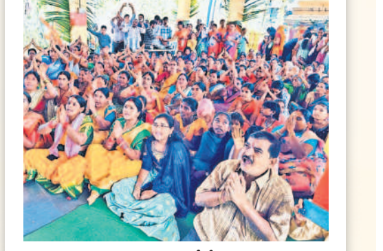
ఏటూరునాగారంలో శ్రీరాముడి ప్రాణ ప్రతిష్ఠను వీక్షిస్తున్న భక్తులు