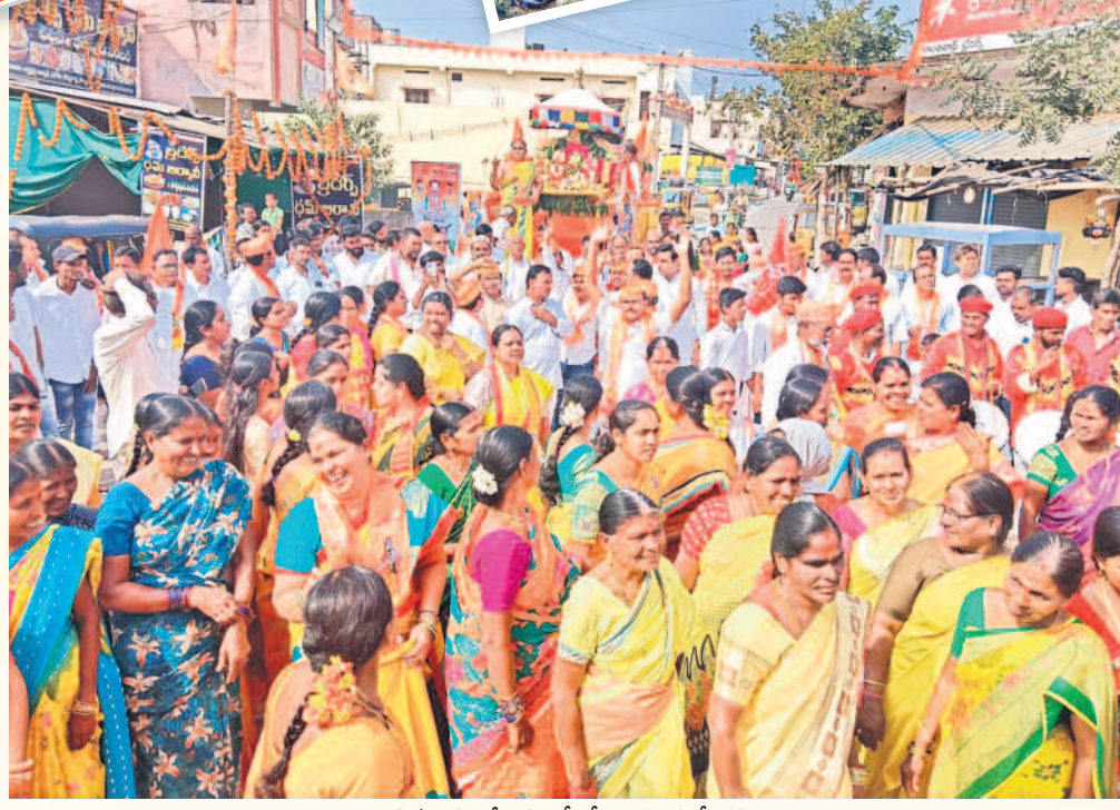
గార్ల మండల కేంద్రంలో శోభాయాత్రలో భక్తులు