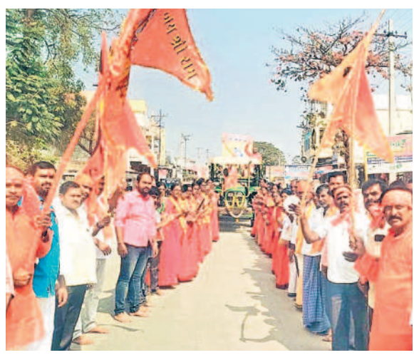
నర్సేపల్లిలో శ్రీరాముడి శోభాయాత్రలో పాల్గొన్న భక్తులు