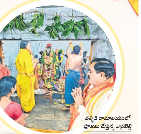
వర్మిడి రామాలయంలో పూజలు చేస్తున్న ఎర్రబెల్లి