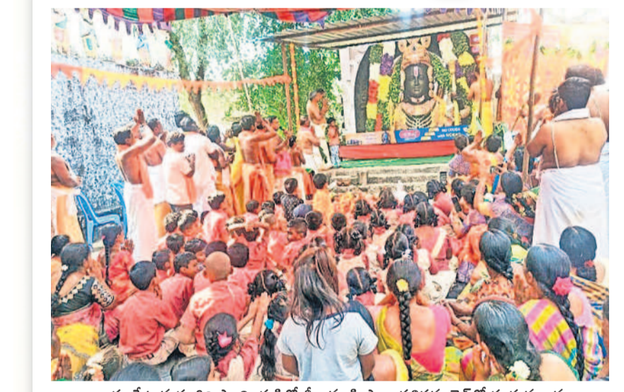
శాయంపేట మత్స్యగిరి స్వామి గుడిలో శ్రీరాముడి ప్రాణ ప్రతిష్ఠను లైవ్లో చూస్తున్న జనం