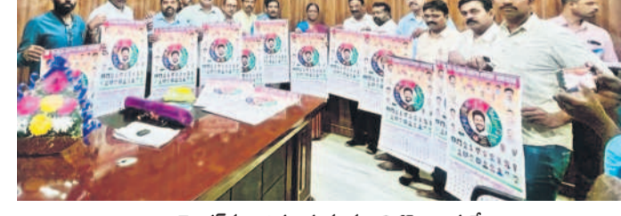
కాలెండరును అవిష్కరిస్తున్న మంత్రి కొండా సురేఖ