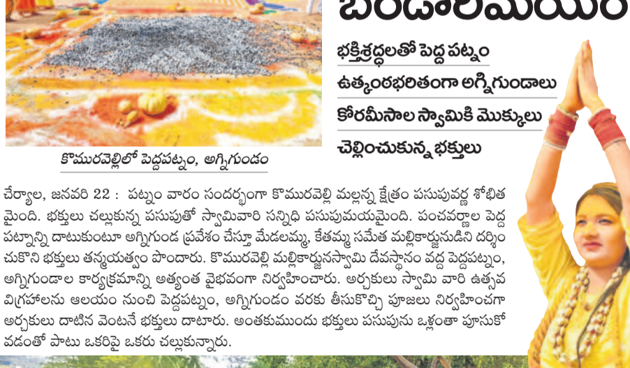
కొమురవెల్లిలో పెద్దపట్నం, అగ్నిగుండం