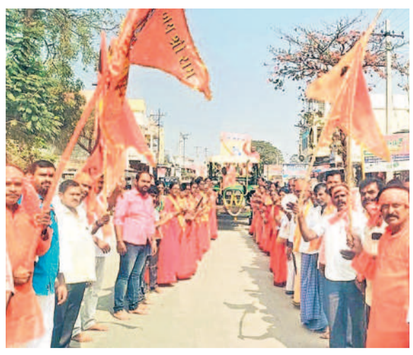
నడకలలో శ్రీరాముడి శోభాయాత్రలో పాల్గొన్న భక్తులు

నమస్తే తెలంగాణ వరంగల్ హనుమకొండ 5 మంగళవారం 23 జనవరి 2024 WARANGAL HANUMAKONDA