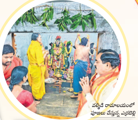
వర్షాది రామాలయంలో పూజలు చేస్తున్న ఎర్రబెల్లి

రామ నామస్మరణతో మార్చే గిన ఆలయాలు పలుచోట్ల బాలరాముడి ప్రాణప్రతిష్ఠ లైవ్ అపురూప ఘట్టాన్ని కనులారా వీక్షించి తరించిన భక్తజనం ఊరారా ఉత్సవ విగ్రహాలు, చిత్రపటాలతో శోభాయాత్ర భక్తిపారవశ్యంలో మునిగితేలిన జనం