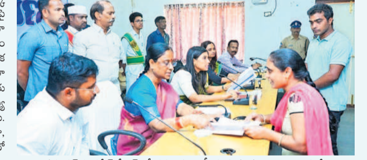
వరంగల్ కలెక్టరేట్ గ్రీన్స్ లో దరఖాస్తులు స్వీకరిస్తున్న మంత్రి కొండా సురేఖ