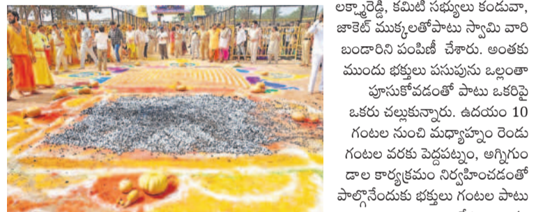
కొమురవెల్లిలో పెద్దపట్టుం, అగ్నిగుండం

పట్టుం వారం సందర్భంగా కొమురవెల్లి మల్లన్న క్షేత్రం పసుపువర్ష శోభితమైంది. భక్తులు చల్లుకున్న పసుపుతో స్వామివారి సన్నిధి పసుపుమయమైంది. పంచవర్షాల పెద్ద పట్టున్ని దాటుకుంటూ అగ్నిగుండ ప్రవేశం చేస్తూ మేడలమ్మ, కేతమ్మ సమేత మల్లికార్జునుడిని దర్శించుకొని భక్తులు తన్మయత్వం పొందారు. కొమురవెల్లి మల్లికార్జునస్వామి దేవస్థానం వద్ద పెద్దపట్టుం, అగ్ని గుండాల కార్యక్రమాన్ని అత్యంత వైభవంగా నిర్వహించారు.