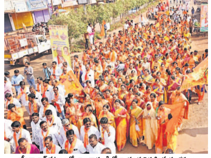
జిహారాబాద్ పట్టణంలో బాల రాముడి శోభాయాత్ర నిర్వహిస్తున్న భక్తులు

- సిద్దిపేట, జనవరి 22 (నమస్తే తెలంగాణ ప్రతినెల)