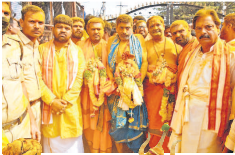
ఉత్సవ విగ్రహాలు తీసుకొస్తున్న ఆలయ ప్రధానాధ్యక్షుడు, చైర్మన్, కమిటీ సభ్యులు