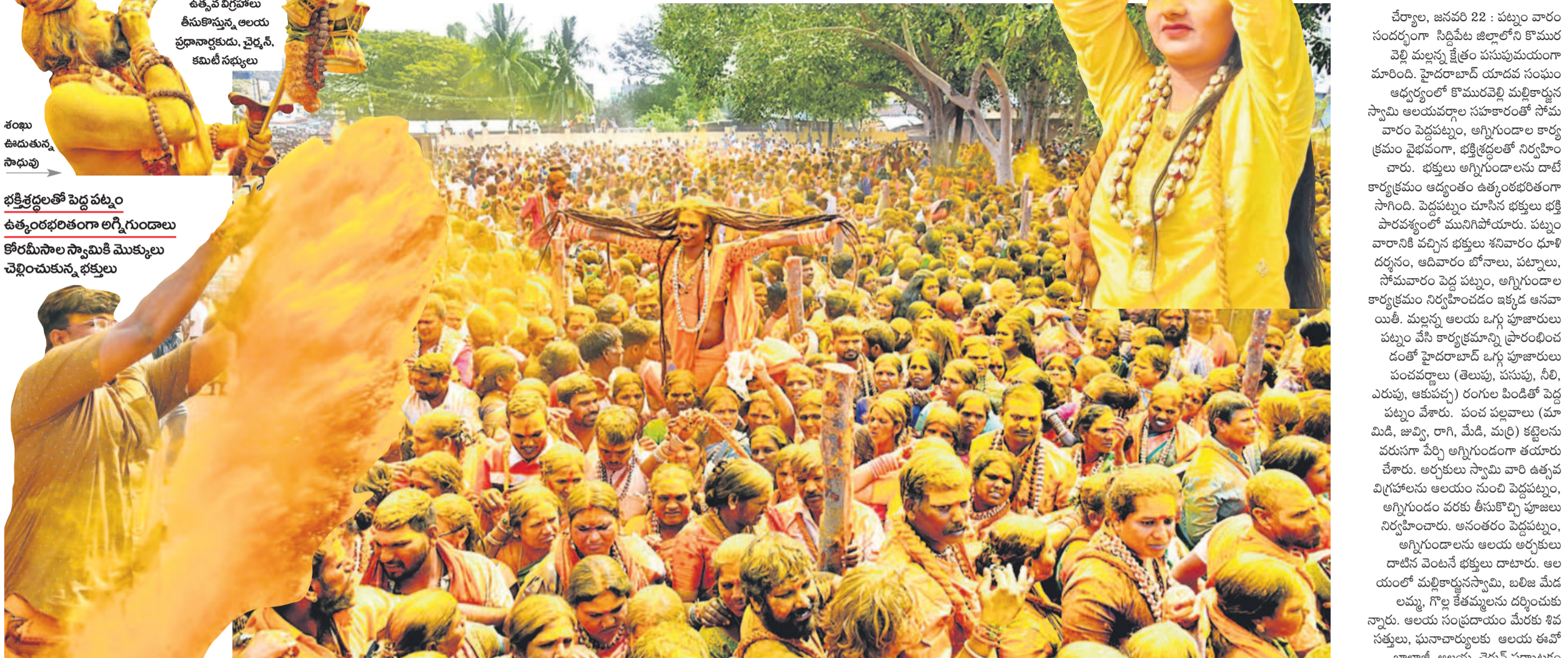
కొమురవెల్లి మల్లన్న క్షేత్రంలో అగ్నిగుండం, పెద్దపట్టుం తొక్కెందుకు వచ్చిన హైదరాబాద్ శివసత్తులు, జోగినిలు, భక్తులు