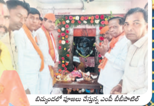
బిమ్మండల్ పూజలు చేస్తున్న ఎంపీ బీబీపాటిల్