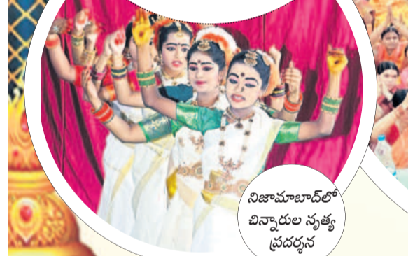
నిజామాబాద్లో బిన్నాదల నృత్య ప్రదర్శన

అయోధ్యలో బాల రాముడి ప్రాణ ప్రతిష్ఠ సుమారుగా జరిగిన కార్యక్రమాలను టీవీలో చూసిన జనాలంతా జైశ్రీరాం నివాదాలతో హోరత్తించారు. అద్భుతమైన ఘడియ కోసం వేయి కండ్లతో ఎదురుచూసిన వారంతా ప్రధాని సరేంద్ర మోడి చేతుల మీదుగా జరిగిన అపురూపమైన చారిత్రక ఘట్టాన్ని కండారా వీక్షించారు. వివిధ చారిత్రక ఘట్టాల్లో పాల్గొన్న కర సేవకులంతా అలయల్లో ప్రత్యేక పూజలు నిర్వహించి నాటి అనుభవాలను గుర్తుచేసుకున్నారు.