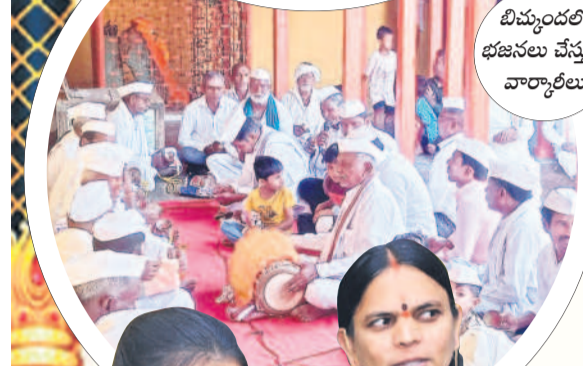
బిమ్మండల్ భజనలు చేస్తున్న వార్షాలీలు