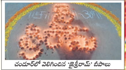
చందూల్లో వెలిగించిన 'జైశ్రీరామ్' దీపాలు