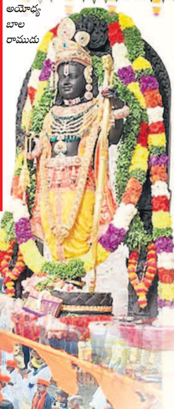
బీద్యూర్లో శోభాయాత్ర నిర్వహిస్తున్న భక్తులు

బాలరాముడు తన సొంత ఇంటికి చేరిన వేళ ఉమ్మడి జిల్లాల్లోని అన్ని రామాలయాలు, ఇతర దేవాలయాల్లో ప్రత్యేక పూజలు, ఇతరత్రా ధార్మిక కార్యక్రమాలను పెద్ద ఎత్తున నిర్వహించారు. ఉదయం నుంచి పంపామ్మతాటిపేటకు, స్వామి వారికి విశేష అలంకరణ, అష్టోత్తర శతనామార్చన, రామాయణ పారాయణం చేశారు. మధ్యాహ్నం 12 గంటల నుంచి అయోధ్యలో నిర్వహించిన కార్యక్రమాల ప్రసారాలను ప్రత్యేక ఎలక్ట్రానిక్ స్క్రీన్లపై ప్రసారం చేశారు. ధార్మిక సంస్థల అధ్యక్షులలో భజనలు, సామూహిక హనుమాన్ చాలీసా పారాయణం, శ్రీరాముడి విజయమంత్రం జపించారు. ఆలయాల వద్ద అన్నదానాలు నిర్వహించారు. ఉమ్మడి జిల్లా వ్యాప్తంగా కూడళ్లలో, ఇండ్లపై కాషాయ జెండాలను ఏర్పాటు చేశారు. ప్రధాన పట్టణాల్లో అయోధ్య సంస్థల ప్రతినిధులతో విగ్రహ ప్రతిష్ఠా శుభాకాంక్షలు చెబుతూ హోర్డింగ్లు, బ్యానర్లు సైతం ఏర్పాటు చేశారు.