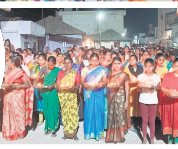
ఇంద్రాయిలో దీపాలతో ఊరేగింపుగా వస్తున్న భక్తులు