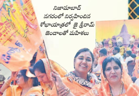
నిజామాబాద్ నగరంలో నిర్వహించిన శోభాయాత్రలో జై శ్రీరామ్ జెండాలతో మహిళలు