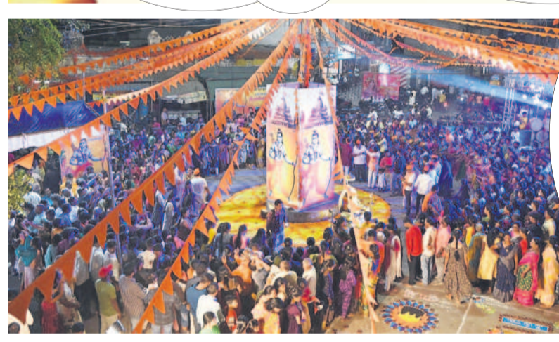
నిజామాబాద్ నగరంలోని గోల్డెన్ హార్మ్ వద్ద దీపాలు వెలిగిస్తున్న భక్తులు