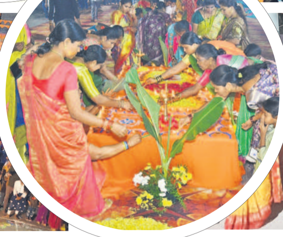
శంభుని గుడి వద్ద..