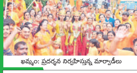
ఖమ్మం: ప్రదర్శన నిర్వహిస్తున్న మార్వాడీలు

- భద్రాద్రి కొత్తగూడెం, జనవరి 22 (నమస్తే తెలంగాణ) / ఖమ్మం