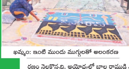
ఖమ్మం: ఇంటి ముందు ముగ్గులతో అలంకరణ

రణం నెలకొన్నది. అయోధ్యలో బాల రాముడి విగ్రహ ప్రాణప్రతిష్ఠ మహోత్సవాన్ని పురస్కరించుకొని భక్తిభావం ఉద్ఘాటించింది. రామయ్య సీతమ్మ లక్ష్మణుడు, హనుమంతుడి వేషధారణలో విన్యాసాలు సందడి చేశారు. మహిళలు, యువతులు రామయ్య పాటలు పాడుతూ కోలాటాలతో శోభాయాత్రలు నిర్వహించారు. పలుచోట్ల అన్నదానాలు నిర్వహించారు. అయోధ్యలో జరిగిన వేడుకను తెలంగాణకు గ్రామాల్లో భక్తమండళ్లు భారీ స్ట్రీటు పర్యటనలు చేశారు. ఇక్కడో సైతం కుటుంబసమేతంగా ఆ అపురూప ఘట్టాన్ని టీవీలో తెలిపారు. అయోధ్య నుంచి వచ్చిన తలంబ్రాలను ఇంటింటికి పంపిణీగా వాటిని పూజా మందిరంలో ఉంచి భక్తిశ్రద్ధలతో పూజలు చేశారు. భద్రాచలం రామాలయంలో ప్రత్యేక కార్యక్రమాలు నిర్వహించారు. ఖమ్మంలోని పలు ప్రధాన సింట్లలో గల వ్యాపార సమూహాలు, దుకాణాలు ఎదుట గంటలు కొట్టి భక్తివాదాన్ని చాటుకున్నారు. కొత్తగూడెం జిల్లాకేంద్రంలోని రెటినెన్సీలో త్రిమాత శక్తిపీఠం వద్ద భారీ ఎల్ఈడిలు చాటుచేశారు. సాయంత్రం ఇళ్ల ముంగిళ్లలో దీపాలు వెలిగించారు.