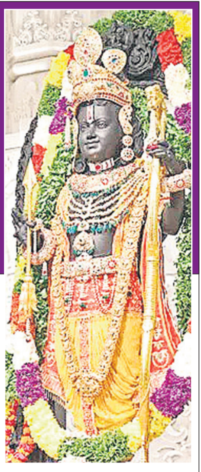
భద్రాద్రిలో ప్రత్యేక పూజలు