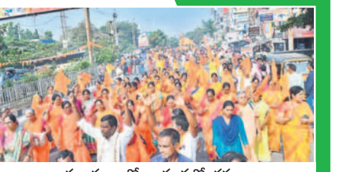
భద్రాచలం శోభాయాత్రలో భక్తులు