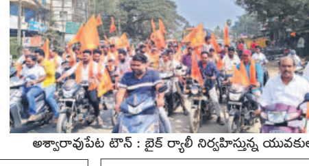
అశ్వారావుపేట టౌన్ : బైక్ ర్యాలీ నిర్వహిస్తున్న యువకులు