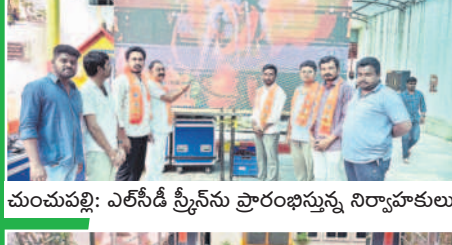
మంచుపల్లి: ఎల్సీడి స్ట్రీట్స్ ప్రారంభిస్తున్న నిర్వాహకులు