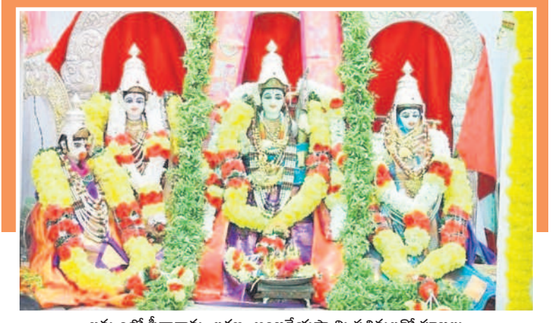
ఖమ్మంలో సీతారామ, లక్ష్మణ, ఆంజనేయస్వామి ప్రతిమలతో పూజలు