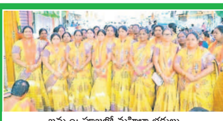
ఖమ్మం: పూజలో మహిళా భక్తులు