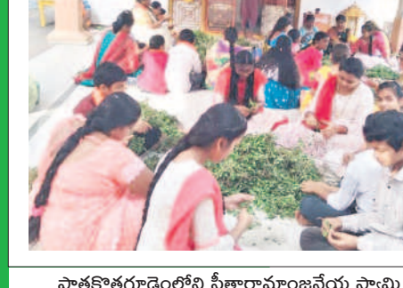
పాతకొత్తగూడెంలోని సీతారామంజనేయ స్వామి ఆలయంలో తులసీదళాల అర్చనలో పాల్గొన్న భక్తులు