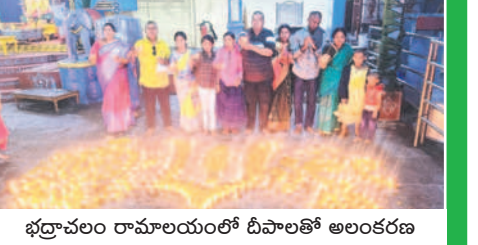
భద్రాచలం రామాలయంలో దీపాలతో అలంకరణ