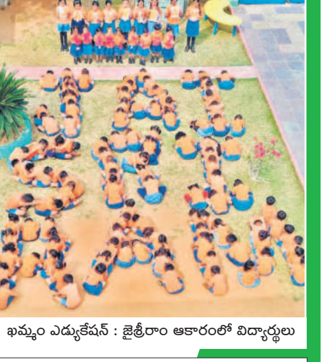
ఖమ్మం ఎడ్యుకేషన్ : జైత్రీరాం ఆకారంలో విద్యార్థులు