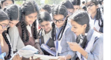
అడుగులు పడుతున్నాయి. అలాగే సర్కార్ పాఠశాలలో డిసెంబర్ - 2024 ఎఫ్ఎల్ఎస్ విలపాలి అవీమెంట్ రిపోర్ట్, పర్ఫార్మెన్స్, అభ్యాస దీపి కమిటీ, ఐఎస్ఎస్ఎస్, ఇతర డిజిటల్ రిపోర్టింగ్ వినియోగం, ఇంగ్లీష్ మీడియం అమలుపై కలెక్టరేట్ సమీక్షించనున్నారు.