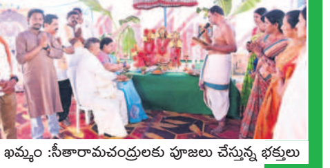
ఖమ్మం : సీతారామచంద్రులకు పూజలు చేస్తున్న భక్తులు