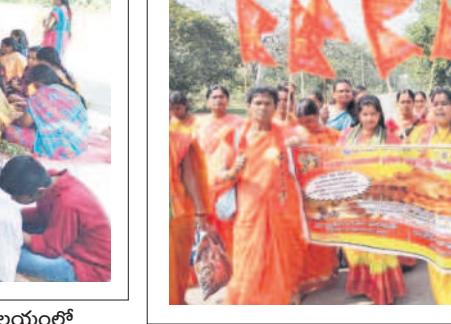
మణుగూరుటౌన్: ప్రదర్శన నిర్వహిస్తున్న భక్తులు

జనం.. అయోధ్యలో వైభవంగా బాల రాముడి విగ్రహ ప్రాణప్రతిష్ఠ మహోత్సవం