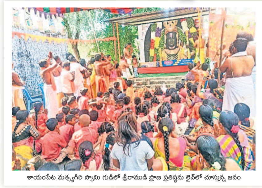
శాయంపేట మత్స్యగిరి స్వామి గుడిలో శ్రీరాముడి ప్రాణ ప్రతిష్ఠను లైవ్లో చూస్తున్న జనం