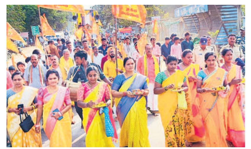
ఏటూరునాగారంలో ర్యాలీగా వస్తున్న భక్తులు