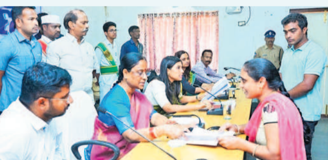
వరంగల్ కలెక్టరేట్ గ్రీవెన్స్ లో దరఖాస్తులు స్వీకరిస్తున్న మంత్రి కొండా సురేఖ