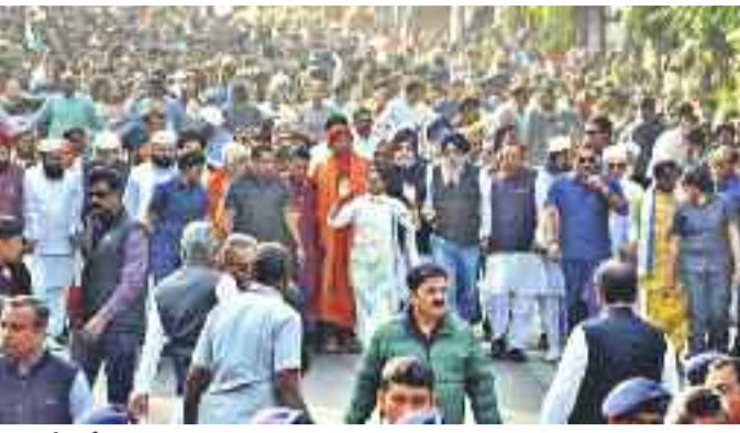
టీఎంసీ అధినేత్ర మమత బెనర్జీ ఆధ్వర్యంలో కోటికాలో 'మత సామరస్య' ర్యాలీ

అని, తనకు ఆహ్వానం అందిందని, అయితే ఆయోధ్యకు కుటుంబంతో తర్వాత వెళ్తామని కేజ్రీవాల్ అంతకుముందు పేర్కొన్నారు.