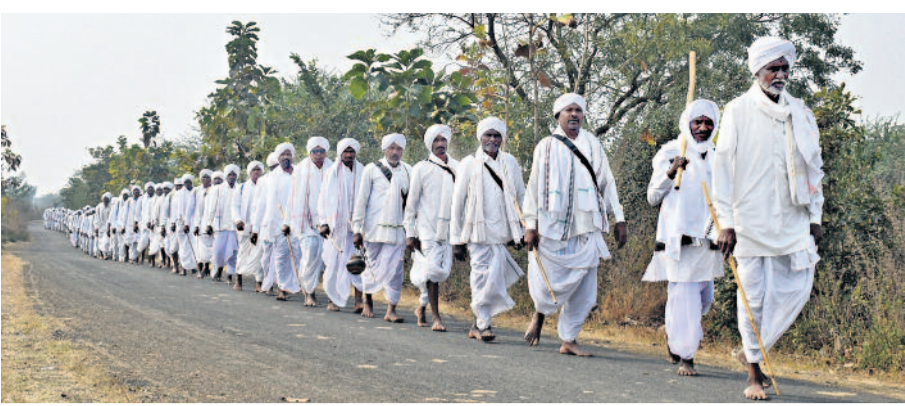
నాగోబా జాతరలో భాగంగా గంగాజలం తీసుకురావడానికి కాలినడకన వెళ్తున్న మెర్రం వంశీయులు