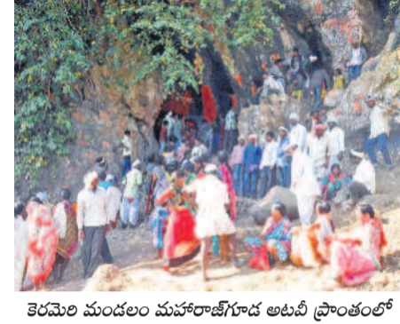
కెరెంపల మండలం మహారాజీగూడ అంటి ప్రాంతంలో జంగుబాయి దేవత గూడు ముందు భక్తులు

ఆదిలాబాద్ జిల్లా నార్కూర్ మండలం కేంద్రంలో ఖాండేవ్ ఆలయం ఉన్నది. తొడసం వంశీయులు ఇలవెల్లు ఆలయ ఖాండేవ్ ప్రత్యేక పూజలతో ఈ జాతర ప్రారంభమవుతుంది. బదు రోజులపాటు జాతర కొనసాగుతుంది. ఈ జాతరలో తొడసం వంశీయుల ఆడవదుడు రెండు రోజులపాటు స్వామి వారి ఆరాధనలో పాల్గొంటారు. అనంతరం తొడసం మహిళల బేటింగ్ ఉంటుంది. తెలంగాణతోపాటు మహారాష్ట్రలోని వివిధ ప్రాంతాల నుంచి ప్రజలు జాతరకు తరలివస్తారు.