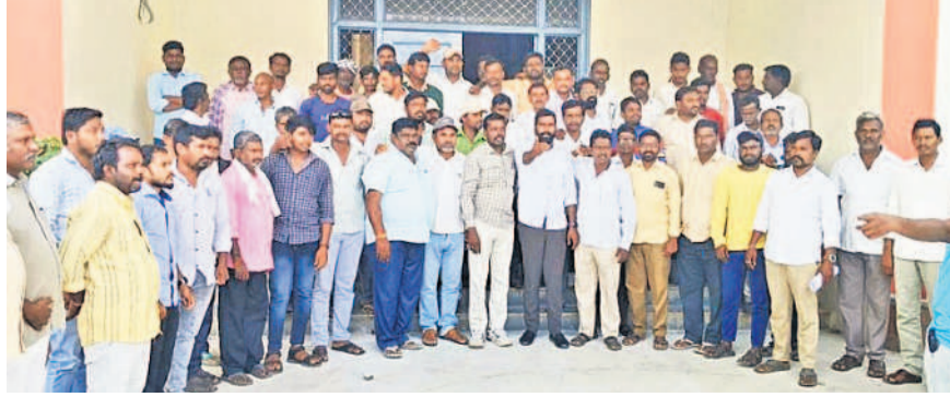
సమావేశంలో పాల్గొన్న దళితబంధు లబ్ధిదారులు

ఈ నెల 25న నిర్వహించే నిరసన దీక్షకు దళితబంధు లబ్ధిదారులు, దళిత సంఘాల నాయకులు, మద్దతుదారులను ఆహ్వానిస్తున్నట్లు తెలిపారు. కార్యక్రమంలో వివిధ