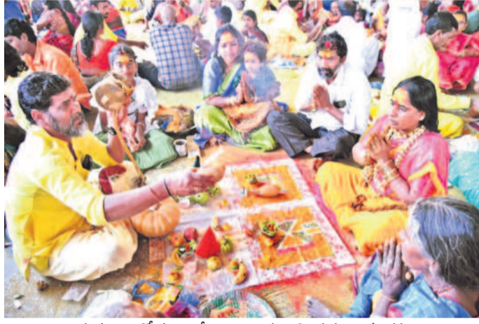
ఒగ్గు పూజారితో పట్టణం వెండిపి మొక్క చెల్లించుకుంటున్న భక్తులు