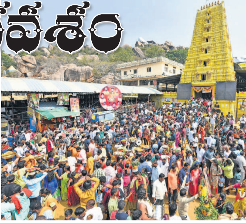
కొమురవెల్లి ఆలయ రాజగోపురం వద్ద భక్తుల రద్దీ

చేర్యాల, జనవరి 21: కొమురవెల్లి మల్లన్న ఉత్సవాలు పట్టణం వారంతో ఆది వారం వైభవంగా ప్రారంభం కాగా.. 75వేల మంది భక్తులు తరలివచ్చారు. బ్రహ్మోత్సవాల్లో మొదటి వారం పట్టణం వారంగా పిలువడం ఆనవాలుగా వస్తున్నది. ఈ క్రమంలో భక్తులు పెద్దసంఖ్యలో వచ్చి స్వామి వారిని దర్శించుకున్నారు. ఆనంతరం చిలుక పట్టణం, గంగిరెగ్గ చెట్టు వద్ద నజమ పట్టణం, మహామండలంలో ముఖమండప పట్టణం వేసి మొక్కలు తీర్చుకున్నారు. చేర్యాల, సిద్దిపేట, హైదరాబాద్, కరీంనగర్, వరంగల్, జనగామ తదితర జిల్లాల నుంచి భక్తులు అట్టేసి బస్సులు, ప్రైవేట్ వాహనాల్లో భారీగా కొమురవెల్లి క్షేత్రానికి తరలివచ్చారు.