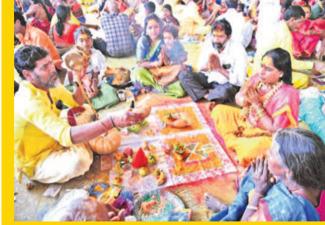
ఒగ్గు పూజారులతో పట్టుం వేయించి మొక్కు చెల్లించుకుంటున్న భక్తులు