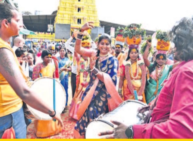
బోనాలతో శివసత్తుల పూసకాలు, నృత్యం చేస్తున్న మహిళా భక్తులు