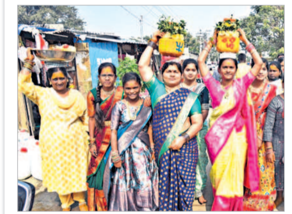
కుటుంబ సభ్యులతో బోనం తీసుకుపోతున్న మహిళలు