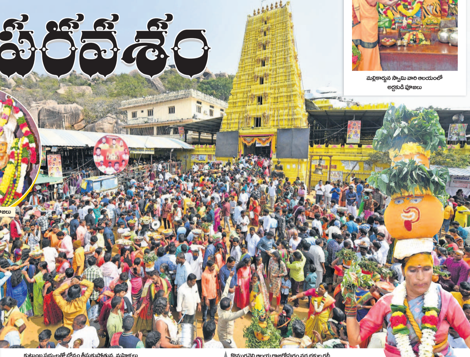
కొమురవెల్లి ఆలయ రాజగోపురం వద్ద భక్తుల రద్దీ