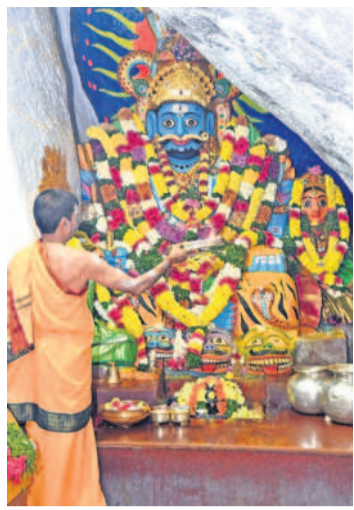
మల్లికార్జున స్వామి వారి ఆలయంలో అర్చకుడి పూజలు

గజ్జెల లాగులు.. డహరుక నాదాలు.. డోలు చప్పుళ్లు.. అర్చకుల పూజలు.. ఒగ్గు పూజారుల పట్నాలు.. పోతరాజుల విన్యాసాలు.. మహిళల బోనాల సమర్పణతో సిద్దిపేట జిల్లాలోని కొమురవెల్లి మల్లన్న క్షేత్రం పులకించిపోయింది. ఆదివారం పట్టు వారంతో క్షేత్రంలో బ్రహ్మాత్మవాయి ప్రారంభమయ్యాయి. స్వామివారి దర్శనానికి భక్తులు పోటిపెట్టారు. మల్లన్న నామస్మరణతో క్షేత్రం పరవశించింది.