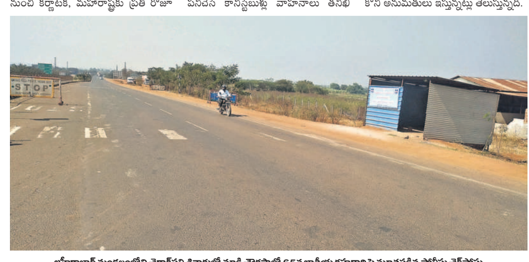
జహీరాబాద్ మండలంలోని చెరాగపల్లి శివారులో మ్యాడ్ల ఛార్జిస్ వద్ద 85వ జాతీయ రహదారిపై మూతపడిన పోలీస్ చెక్పోస్టు

రాష్ట్ర ప్రభుత్వం కర్ఫాటక, మహారాష్ట్ర నుంచి వచ్చే వాహనాలను తనిఖీ చేసేందుకు జహీరాబాద్ మండలంలోని చెరాగపల్లి వద్ద 85వ జాతీయ రహదారిపై ఎక్సైజ్ చెక్పోస్టును ఏర్పాటు చేసింది. ఇద్దరు సీబి, ఎస్ఐలు, సిబ్బంది ఉన్న చెక్పోస్టులో కానిస్టేబుల్ల మాత్రమే విధులు నిర్వహిస్తారు. సీబిలు వారానికి ఒకసారి వచ్చిపోతారని, దీంతో చెక్పోస్టులో పనిచేసే కానిస్టేబుల్ల వాహనాలు తనిఖీ