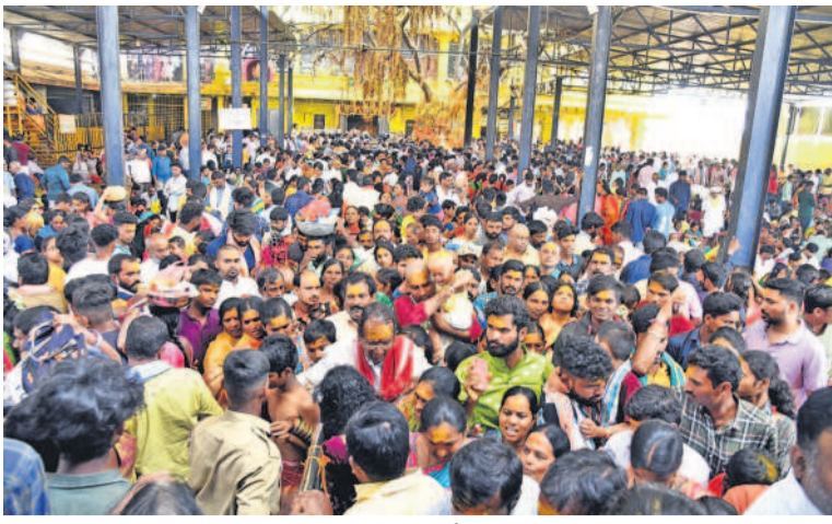
కొమురవెల్లి మల్లన్న ఆలయ గంగేరి చెట్టు వద్ద భక్తుల రద్దీ