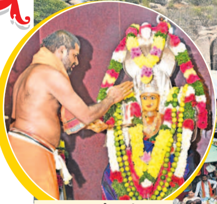
ఎల్లమ్మ ఆలయంలో అర్చకుడి పూజలు

కోటి దండాలయ్యా.. కోరమసాలయ్య మల్లన్న దర్శనంతో పులకించిన భక్తజనం తొలిరోజు 75వేల మంది భక్తుల రాక నేడు కొమురవెల్లి క్షేత్రంలో పెద్ద పట్టుం, అగ్నిగుండం