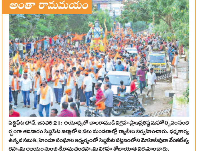
సిద్దిపేట టౌన్, జనవరి 21: అయ్యాగోటి బాలరామదేవిగ్రామ ప్రాంతాల్లో మహాత్మ్యం సందర్భంగా ఆదివారం నిర్వహించిన జిల్లాలోని పలు మండలాల్లో ర్యాపిడ్ నిర్వహించారు. ధర్మకార్య ఉత్సవ సమితి, హిందూ సంఘాల ఆధ్వర్యంలో సిద్దిపేట పట్టణంలోని మోహనీపురా వేంకటేశ్వరస్వామి ఆలయం నుంచి శ్రీరామచంద్రస్వామి విగ్రహా శోభాయాత్ర నిర్వహించారు.