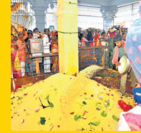
ఎల్లమ్మకు భక్తులు సమర్పించిన ఒడి బియ్యం