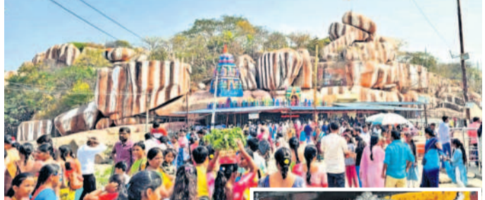
మెదక్ జిల్లాలోని ఏడుపాయల వనదుర్గా ఆలయం ఎదుట భక్తుల సందడి