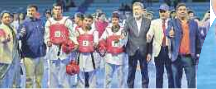
వైకాండ్ ప్రీమియర్ లీగ్ సీజన్-1లో భాగంగా ఆదివారం హైదరాబాద్లో జరిగిన పోటీల్లో హర్షానా హంటర్స్ టీమ్ 38-21, 52-8, 34-10తో మహారాష్ట్ర అవెంజర్స్పై విజయం సాధించింది.

హైదరాబాద్, ఆట ప్రతినిధి: హైదరాబాద్ పాఠశాలలో ఆగ్రెస్సానం డక్టింగుకుంది. ప్రెమియర్ గోల్డ్ లీగ్ నాలుగో ఎడిషన్ ట్రోఫీని గెలుపొందింది. ఈ సీజన్లో 16 జట్లు పాల్గొని గ్రూపుల్లో తలచుకున్నాయి. ఆదివారం పూజీ గోల్డ్ లీగ్ టోర్నీలో జరిగిన తొలి రౌండ్లో మీనాక్షి మేవరిక్స్ జట్టు 210 పాయింట్లతో అగ్రస్థానం దక్కించుకుంది. గ్రూప్-డిలో బరిలో దిగిన మేవరిక్స్ జట్టులో నలుగురు గోల్డెన్ తలో 38 పాయింట్లు సాధించారు. గ్రూప్ డలో టాప్-8లో నిలిచిన జట్టు క్వార్టర్స్ చేరుతాయి. తుదిపోరు తొలి రౌండ్లో మీనాక్షి మేవరిక్స్ జట్టు 210 పాయింట్లతో అగ్రస్థానం దక్కించుకుంది. గ్రూప్-డిలో బరిలో దిగిన మేవరిక్స్ జట్టులో నలుగురు గోల్డెన్ తలో 38 పాయింట్లు సాధించారు. గ్రూప్ డలో టాప్-8లో నిలిచిన జట్టు క్వార్టర్స్ చేరుతాయి. తుదిపోరు తొలి రౌండ్లో మీనాక్షి మేవరిక్స్ జట్టు 210 పాయింట్లతో అగ్రస్థానం దక్కించుకుంది.