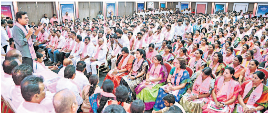
తెలంగాణ భవన్ లో నిర్వహించిన మల్కాజిగిరి పార్లమెంట్ సమావేశం సమావేశంలో మాట్లాడుతున్న బీఆర్ఎస్ వర్కింగ్ ప్రెసిడెంట్ కేటీఆర్

బీఆర్ఎస్ ను లేకుండా చేసే శక్తి ఎవ్వరికీ లేదు