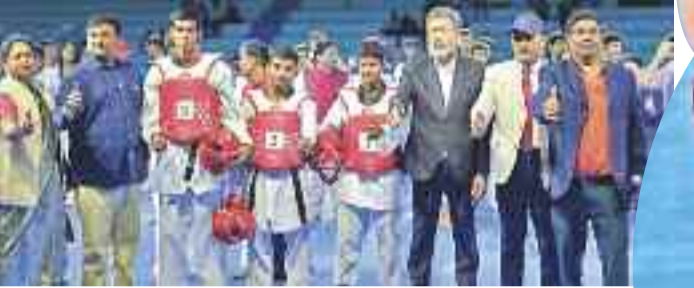
వైకాండ్ ప్రీమియర్ లీగ్ సీజన్-1లో భాగంగా ఆదివారం హైదరాబాద్లో జరిగిన పోటీల్లో హర్షానా హంబర్ట్ బీమ్ 38-21, 52-8, 34-10తో మహారాష్ట్ర అవెంజర్స్పై విజయం సాధించింది.

హైదరాబాద్, ఆట ప్రతినది: హైదరాబాద్ ప్రెమియర్ గోల్ఫ్ లీగ్ నాలుగో ఎడిషన్ ఘనంగా ప్రారంభమైంది. ఈ సీజన్లో 16 జట్లు నాలుగు గ్రూపుల్లో తలదాచుకున్నాయి. ఆదివారం పూజీ గోల్ఫ్ కోర్ట్లో జరిగిన తొలి రౌండ్లో మీనాక్షి మేవరిక్స్ జట్టు 210 పాయింట్లతో అగ్రస్థానం దక్కించుకుంది. గ్రూప్-డిలో బరిలో దిగిన మేవరిక్స్ జట్టులో నలుగురు గోల్ఫర్లు తలో 38 పాయింట్లు సాధించారు. గ్రూప్ డలో టాప్-8లో నిలిచిన జట్టు క్వాలిఫైర్ చేరుతాయి. తుదిపోరు తొలి రౌండ్లో మీనాక్షి మేవరిక్స్ జట్టు 210