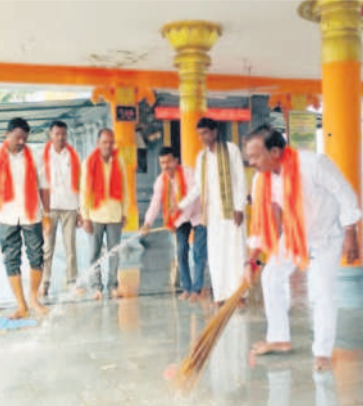
రాములయాన్ని శుభ్రం చేస్తున్న భక్తులు

గ్రామాల్లోని శ్రీవేంకటేశ్వరాలయాలలో విశేష పూజాకార్యక్రమాలు చేపట్టారు. అందులో భాగంగా ఆదివారం రాత్రి నుంచి భజనా కీర్తనలు ఆరంభించి సోమవారం రాత్రి వరకు కొనసాగించినట్లు తెలిపారు. శోభాయాత్ర, మహా అన్నదానం నిర్వహిస్తున్నారు. ఉట్టూర్లో.. ఉట్టూర్, జనవరి 21: ఉట్టూర్ మండలం కేంద్రంలోని అంగడి