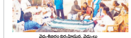
వైద్య శిబిరం నిర్వహిస్తున్న వైద్యులు