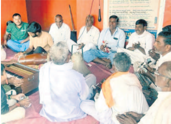
భజనలో పాల్గొన్న భక్తులు

భీంపూర్, జనవరి 21: అయోధ్యలో బాలరాముడి ప్రాణప్రతిష్ఠా సేవధ్యంలో సోమవారం భీంపూర్ మండలం కంజలి (టి), అల్ల (టి), అంతర్గాం రాములయాలు సహా నివాసి, పిల్లకోటి ఉట్టూర్, జనవరి 21: ఉట్టూర్ మండలం కేంద్రంలోని అంగడి