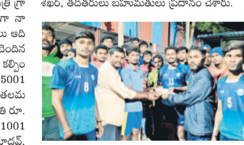
బహుమతి లభించుకున్న విజేత జట్టు