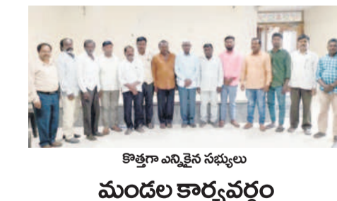
కొత్తగా ఎన్నికైన సభ్యులు