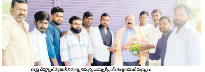
రాష్ట్ర డిప్యూటీ సీక్రటరీని సన్మానిస్తున్న ఎమ్మార్పీఎస్ జిల్లా కమిటీ సభ్యులు