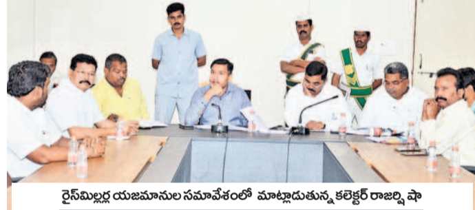
రైస్ మిల్లర్ల యజమానుల సమావేశంలో మాట్లాడుతున్న కలెక్టర్ రాజర్షి పా

మెదక్, జనవరి 20 (నవంబర్ 20) : సీఎంఆర్ కేటాయింపులో జాప్యాన్ని తీవ్రంగా పరిగణించాలి. మిల్లర్ అలసత్వాన్ని ఏ మాత్రం ఉపేక్షించబోమని కలెక్టర్ రాజర్షి పా అన్నారు. జిల్లాలోని రైస్ మిల్లర్లలో సీఎంఆర్ కేటాయింపుపై నిర్లక్ష్యానికి తావిస్తే తీవ్ర చర్యలు తీసుకుంటామని హెచ్చరించారు. అధిక శాతం సీఎంఆర్ కేటాయింపుపై నిర్లక్ష్యానికి తావిస్తే తీవ్ర చర్యలు తీసుకుంటామని హెచ్చరించారు. అధిక శాతం సీఎంఆర్ కేటాయింపుపై నిర్లక్ష్యానికి తావిస్తే తీవ్ర చర్యలు తీసుకుంటామని హెచ్చరించారు. అధిక శాతం సీఎంఆర్ కేటాయింపుపై నిర్లక్ష్యానికి తావిస్తే తీవ్ర చర్యలు తీసుకుంటామని హెచ్చరించారు.