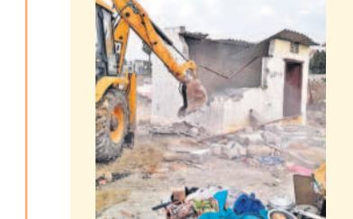
మినీ స్టేడియం స్థలంలో శనివారం అక్రమ నిర్మాణాన్ని కూల్చేస్తున్న బీసీసీ