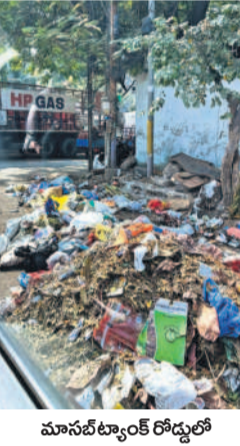
మానవోత్సాహం కోసం పేరుకుపోయిన వ్యర్థాలు

సిటీబ్యూరో, జనవరి 20 (నమస్తే తెలంగాణ) : గ్రేటర్ లో ఇంటింటి చెత్త సేకరణ అక్రమ నిరుగారుతున్నది. ఎక్కడి వ్యర్థాలు అక్కడే పేరుకుపోతున్నాయి. స్వచ్ఛ ప్రాంతాలను దుమ్ముతో ముట్టడిస్తున్నది. చెత్తసేకరణ నగరం తీర్చిదిద్దే చర్యల్లో భాగంగా మూడున్నరేండ్ల కిందట డస్ట్ బిన్ లెస్ సిటీ పేరుతో చెత్త కుండీలను జీవాప్-ఎంసీ తొలగించింది. పక్కపక్కా పారిశుధ్య నిర్వహణ చేపట్టి.. వందకు వంద శాతం ఇంటింటి చెత్త సేకరణకు స్వచ్ఛ ఆటోల సంఖ్యను పెంచారు. సుమారు 5250 వాహనాల ద్వారా సిటీలోని 4888 కాలనీల్లో 23 లక్షల గృహాల నుంచి రోజుకు 7వేల మెట్రిక్ టన్నులకు పైగా వ్యర్థాలను సేకరించాలి. ఒక్కొక్క ఆటోకు సుమారు 500 నుంచి 600 ఇండ్లను కేటాయింది.. చెత్త సేకరణ చేయాలి. కానీ కొన్ని రోజులుగా ఆలా జరగడం లేదు. చాలా కాలనీలకు రోజూ స్వచ్ఛ ఆటోలు రావడం లేదు. వందకు వంద శాతం వాటి అతిండ్లెళ్లు ఉండటం లేదు. ప్రతిరోజూ 1000 స్వచ్ఛ ఆటోలు పనిచేయడం లేదని స్వయంగా కమిషనర్ రోనాల్డ్ రానీ ఇటీవల గుర్తించారు. పర్యవేక్షణ లోపించిందని జోన్లలో కమిషనర్లపై తీవ్ర స్థాయిలో మండిపడ్డారు. స్వచ్ఛ ఆటోల పనితీరులో కఠినంగా వ్యవహరించాలని స్పష్టం చేశారు. కాగా, సమయ పాలన పట్టించుకోకపోవడం, వ్యర్థాల సేకరణలో అధిక వసూళ్లకు తెరలేపడం, సిటీలో ఉండాలిన్న స్వచ్ఛ ఆటోలు గ్రేటర్ సరిపాధులు దాటడం వంటి వ్యవహారాలపై ఇప్పటికే ఫిర్యాదులు వచ్చాయి. ఈ నేపథ్యంలో స్వచ్ఛ ఆటోలను దారిలోకి తీసుకురావాలని, ఉదయం వాహనం బయలుదేరే సమయం.. వ్యర్థాల సేకరణ పూర్తయ్యేకే త్రాన్స్ పర్ స్టేషన్లకు వెళ్లే వరకు 'కూర్ ఆర్' స్కాన్ విధానాన్ని పట్టాగా అమలు చేయాలని నగరపాలకులు కోరుతున్నారు.