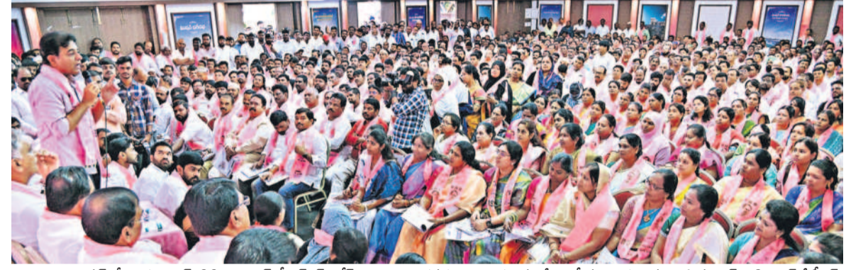
తెలంగాణభవన్లో హైదరాబాద్, సికింద్రాబాద్ బీఆర్ఎస్ లోక్సభ నియోజకవర్గ సమావేశంలో మాట్లాడుతున్న పార్టీ వర్కింగ్ ప్రెసిడెంట్ కేటీఆర్

ఎందుకు బొంద పెడుతావ్? తెలంగాణ తెచ్చినందుకా? తెలంగాణను అభివృద్ధి చేసినందుకా? మిమ్మల్ని మీ దొంగ హామీలను ప్రతిస్పృహించుకోవాలి. బీఆర్ఎస్ను బొంద పెట్టే సంగతి తర్వాత చూసుకుందాం.. 100 రోజుల్లో నెరవేరుస్తామన్న మీ హామీలను అమలు చేసే అంశంపై దృష్టి పెట్టండి. అహంకారంతో మాట్లాడిన రేవంత్రెడ్డి లాంటి నాయకులను బీఆర్ఎస్ తన ప్రస్థానంలో చాలా మందిని చూసింది. మఖల్ పుట్టి పుట్టాలో హోమీ పార్టీ అని మీలాంటివళ్ళు చాలామంది నీలిగిండ్లు. అయినా రెండున్నర దశాబ్దాలు పార్టీ నిలబడి, రేవంత్ లాంటి వాళ్ళను మట్టికరిపించింది అని తెలిపారు. గతంలో అదానీ గురించి అడ్డగోలుగా మాట్లాడిన రేవంత్రెడ్డి, ఇప్పుడు ఆయన వెంటపడుతున్నారని, దావోస్లో అదానీతో అలయ్ బలయ్ చేసుకున్నారని విమర్శించారు. అదానీతో రేవంత్రెడ్డి చేసుకొన్న ఒప్పందాల అసలు గుట్టు బయటపెట్టాలని డిమాండ్ చేశారు. రాహుల్ గాంధీ అదానీకి వ్యతిరేకంగా మాట్లాడితే, రేవంత్రెడ్డి అదానీ కోసం అర్రలు చాస్తున్నారని ద్వేషమెత్తారు. డబుల్ ఇంజనీ అంటే అదానీ, ప్రధాని అన్న రేవంత్.. ఇప్పుడు ట్రిపుల్ ఇంజనీగా మారారని విమర్శించారు.