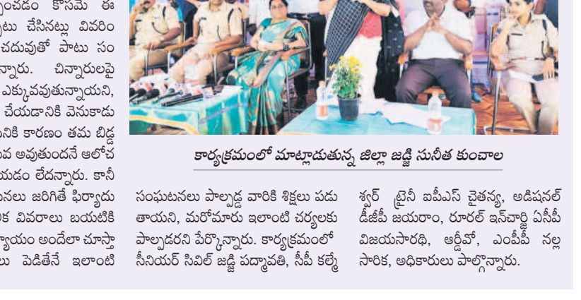
కార్యక్రమంలో మాట్లాడుతున్న జిల్లా జడ్జి సునీత కుంచాల

జిల్లా ప్రధాన న్యాయమూర్తి సునీత కుంచాల దర్శి, జనవరి 20: రాజ్యాంగం ప్రతి పౌరుడికి హక్కులతో పాటు బాధ్యతలను కల్పించింది. జిల్లా న్యాయ సేవా అధికార సంస్థ చైర్మన్, జిల్లా ప్రధాన న్యాయమూర్తి సునీత కుంచాల అన్నారు. ప్రతి ఒక్కరూ తమ బాధ్యతను గుర్తించి చట్టానికి లోబడి వ్యవహరించాలని సూచించారు. మండలంలోని దుబ్బాక గ్రామంలో జిల్లా న్యాయ సేవా అధికార సంస్థ పోలీసులతో కలిసి పరిశీలించారు. చట్టాలపై సరైన అవగాహన లేక కొన్ని పాఠశాలలు చట్టాన్ని ఉల్లంఘించి, జిల్లా ప్రధాన న్యాయమూర్తి పాటు కర్ణాటక రాజ్ గాంధీ హక్కులతో పాటు బాధ్యతలను కల్పించింది. జిల్లా న్యాయ సేవా అధికార సంస్థ చైర్మన్, జిల్లా ప్రధాన న్యాయమూర్తి సునీత కుంచాల అన్నారు. చట్టానికి లోబడి వ్యవహరించాలని సూచించారు. మండలంలోని దుబ్బాక గ్రామంలో జిల్లా న్యాయ సేవా అధికార సంస్థ పోలీసులతో కలిసి పరిశీలించారు. చట్టాలపై సరైన అవగాహన లేక కొన్ని పాఠశాలలు చట్టాన్ని ఉల్లంఘించి, జిల్లా ప్రధాన న్యాయమూర్తి పాటు కర్ణాటక రాజ్ గాంధీ హక్కులతో పాటు బాధ్యతలను కల్పించింది. జిల్లా న్యాయ సేవా అధికార సంస్థ చైర్మన్, జిల్లా ప్రధాన న్యాయమూర్తి సునీత కుంచాల అన్నారు. చట్టానికి లోబడి వ్యవహరించాలని సూచించారు.