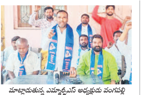
మాట్లాడుతున్న ఎమ్మార్సీఎస్ అధ్యక్షుడు వంగపల్లి

ఎక్కడో గుట్టల్లో నివాసాలు. ఉన్నది కేవలం 12 కుటుంబాలు. నివసించేది 32 మంది. గౌరెలు, మేకల పెంపకం, వ్యవసాయమే ఆధారంగా వైవిధ్యమైన జీవనాన్ని కొనసాగిస్తున్న ఓ తండా కథ ఇది..