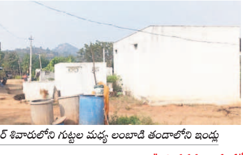
నర్సింకాపూర్ శివారులోని గుట్టల మధ్య లంబాడి తండాలోని ఇండ్లు