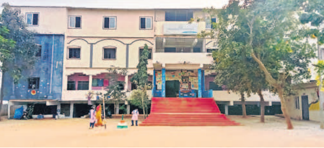
హుజూర్ నగర్లోని మైనారిటీ గురుకుల పాఠశాల

హుజూర్ నగర్, జనవరి 18 : 2024-25 విద్యా సంవత్సరంలో తెలంగాణ రాష్ట్ర మైనారిటీ గురుకుల పాఠశాలలు, జూనియర్ కళాశాలల్లో అడ్మిషన్లకు నోటిఫికేషన్ విడుదలైంది. ఈ నెల 18నుంచి ఫిబ్రవరి 6వరకు ఆన్లైన్ దరఖాస్తు చేసుకోవాలి. 5వ తరగతిలో కొత్త సీట్లకు, 6, 7, 8 తరగతుల్లో (కేవలం మైనారిటీ) ఖాళీలకు దరఖాస్తులు స్వీకరించనున్నారు. మైనారిటీ గురుకుల జూనియర్ కళాశాలల్లో బాలికలు, బాలురు సీట్ల కోసం ఇదే తేదీల్లో ఆన్లైన్ దరఖాస్తు చేసుకోవాలి.