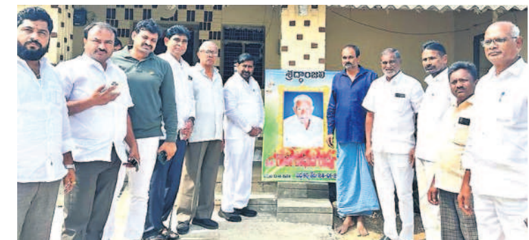
వివ్వెంల : పట్టిభామ్యంపూడిలో రైతు రామవరాపు చిత్రపటం వద్ద నివాళి అర్పిస్తున్న ఎమ్మెల్యే జగదీశ్ రెడ్డి