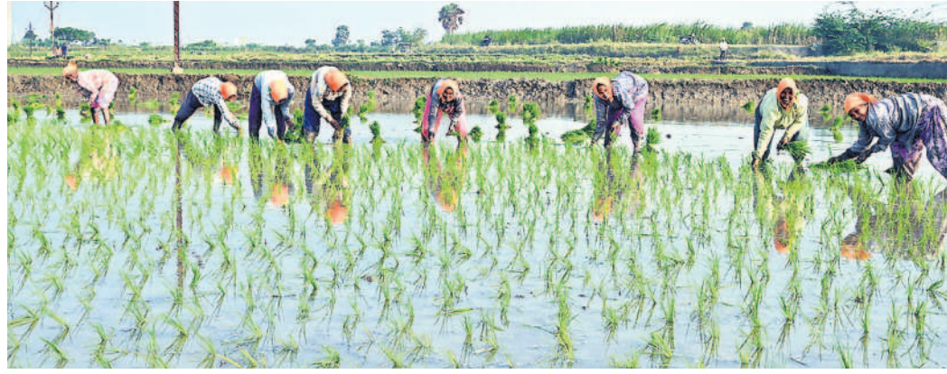
పానగల్లో పొలంలో నాట్లు వేస్తున్న కూలీలు

ప్రాజెక్టుల్లో నిండుకుంటున్న నీటి నిల్వలు యాసంగిపై ఆసక్తి చూపని రైతులు