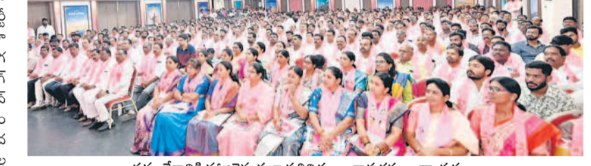
సమావేశానికి హాజరైన ప్రజాప్రతినిధులు, కార్యకర్తలు, నాయకులు

మహబూబ్ నగర్, జనవరి 18 : నమస్తే తెలంగాణ ప్రతినిధి : ఇచ్చిన హామీల అమలులో కాంగ్రెస్ పార్టీ పూర్తిగా విఫలమైందని.. ఈ పరిస్థితి రాష్ట్రంలో కొనసాగితే కేవలం ఆరు నెలల్లోనే ప్రభుత్వంపై ప్రజలు తిరగబడే పరిస్థితి రావడం ఖాయమని బీఆర్ఎస్ వర్కింగ్ ప్రెసిడెంట్ కేటీఆర్ అన్నారు. గురువారం హైదరాబాద్ లోని తెలంగాణ భవన్ లో మహబూబ్ నగర్ పార్లమెంట్ స్థాయి సమీక్షా సమావేశం నిర్వహించారు. ఈ సందర్భంగా హాజరైన గులాబీ పార్టీ నాయకులు, కార్యకర్తల సుదీర్ఘంగా కేటీఆర్ మాట్లాడుతూ హాస్యం పాల్గొని ప్రభుత్వం వచ్చిన కొద్ది రోజుల్లోనే.. సమాజంలోని అనేక వర్గాలు అసంతృప్తిగా ఉన్నాయన్నారు. రాష్ట్ర ప్రభుత్వం ఇచ్చిన హామీలను ఎప్పటికప్పుడు ప్రజలకు.. కాంగ్రెస్ పార్టీకి గుర్తు చేయాలన్న అవసరం ఎంతైనా ఉన్నదన్నారు. రైతు రుణమాఫీ గురించి రేపంతోరెడ్డి పదే పదే చెప్పాడు.. ఒకటేసారి రుణమాఫీ చేస్తే అని చెప్పిన ఆయన మాటలకు భిన్నంగా కోల్పోయిన వాళ్లు చూడమంది ప్రతిపక్షం వారీగా రుణమాఫీ చేస్తామని చెబుతున్నారని, దీన్ని ప్రజల్లోకి తీసుకెళ్లాలని పిలుపునిచ్చారు. రైతు బండ్లు రూ. 10,000 కాదు, రూ. 15000 ఇస్తామన్నా.. నేటికీ రైతుల ఖాతాల్లో పడలేదన్నారు. రూ. 2వేల పిండ్ల నీను రూ. 4 వేలు చేస్తే అన్నా నేటికీ అమలు చేయడం లేదని దుఃఖపడ్డారు. గతంలో రోజుకు పది లక్షల మంది చొప్పున వారం రోజుల్లో 70 లక్షల మందికి పంపి పెట్టబడి సాయం అందించామని గుర్తు చేశారు. కాంగ్రెస్ ని అధికారంలోకి వచ్చి ఇన్ని రోజులైనా రైతుబండ్లు ఖా