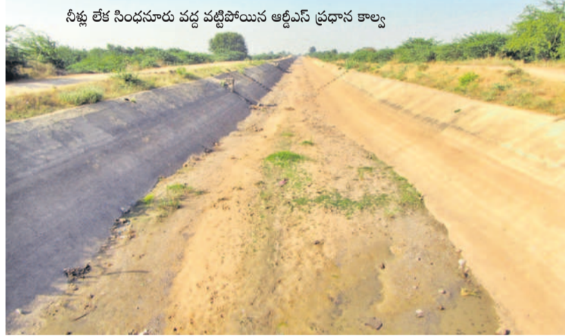
నీళ్ల లేక సింధూరు వద్ద వట్టిపోయిన ఆర్ద్రీని ప్రధాన కార్య

రేపంతో ఎందుకు చేయడం లేదని ప్రశ్నించారు. బీఆర్ఎస్ పై దుర్మతలు రావచ్చు, తిప్పి కొట్టాలి.. బీఆర్ఎస్ కు గ్రామం నుంచి రాష్ట్ర స్థాయి దాకా పెద్ద ఎత్తున అన్ని స్థాయిలలో ప్రాతినిధ్యం ఉన్నదని కేటీఆర్ గుర్తు చేశారు. గ్రామ పంచాయతీ నుంచి పార్లమెంట్ దాకా ప్రతి చోట పార్టీకి బలమైన నాయకత్వం ఉన్నదని, ఇంతటి బలమైన పార్టీ తిరిగి గెలుపు బాట పట్టడం పెద్ద కష్టమేమీ కాదన్నారు. పార్టీపైన గతంలో జరిగిన దుర్మతలన్నీ ప్రజలకు వివరించాల్సిన బాధ్యత మన పార్టీ నాయకులు, కార్యకర్తలపై ఉండదన్నారు. ప్రభుత్వ ఉద్దేశాలు, రేపనే కాదు, సమగ్ర పథకాలను పెద్ద ఎత్తున ప్రజలకు అందించినా మనపై అసత్య ప్రచారం జరిగిందని, దీన్ని తిప్పి కొట్టాలని పిలుపునిచ్చారు. ప్రభుత్వం పార్టీ అనే తేడాను ప్రజలు తెలుసుకోలేకపోయారు.. ప్రజల కోసం చేసిన కార్యక్రమాల బీఆర్ఎస్ పార్టీ ద్వారా జరిగాయన్న విషయాన్ని వివరించా